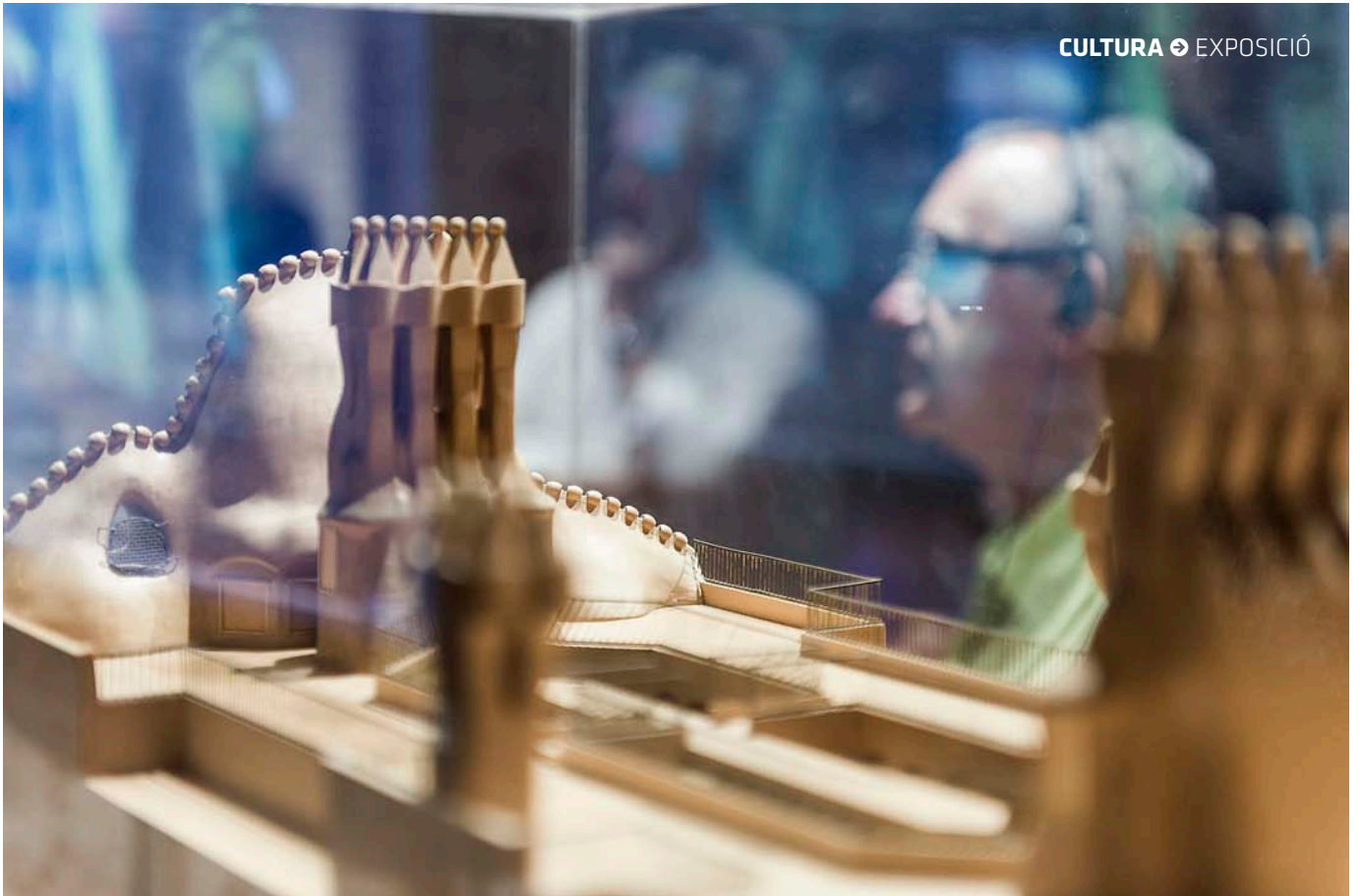
Maqueta de la Casa Batlló, obra de Juan Pablo Marín Almor.