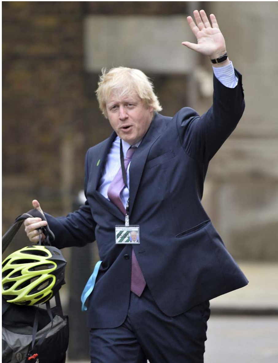
Boris Johnson va a tot arreu en bicicleta. A la fotografia, arriba a casa –el número 10 de Downing Street– amb el casc a la mà.

—Hi ha una fotografia similar de vostè agafant una AK47 al Kurdistan.