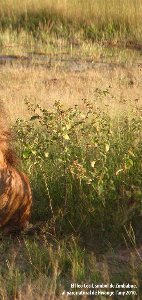
El lleó Cecil, símbol de Zimbàbue, al parc natural de Hwange l'any 2010.

pecialista en la fauna africana, el Govern s'embutxaca fins a un 44% dels beneficis provinents del turisme de la caça.