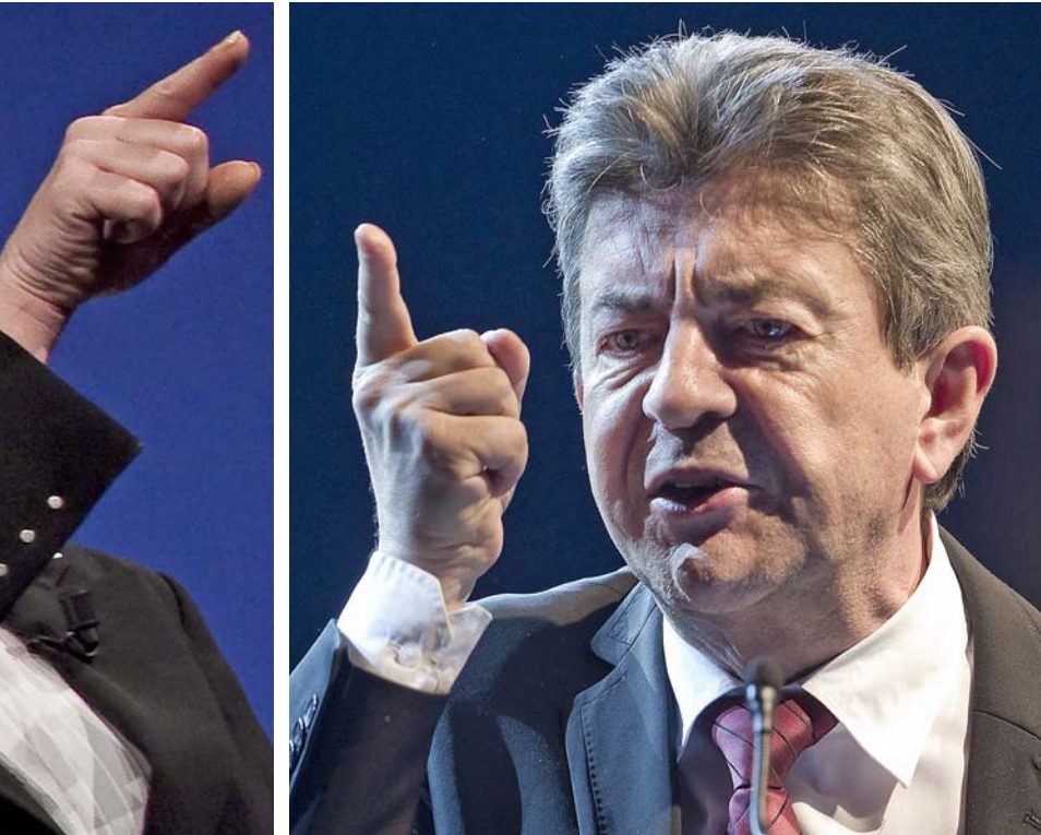
ELS EXTREMS. Els opositors més virulents són el Front Nacional de Marine Le Pen (centre) i el Front d'Esquerra de Jean-Luc Mélenchon (dreta). Les regnes del projecte les duu la ministra Christiane Taubira (esquerra).

el francès". I a continuació ja parla de la composició de la bandera.