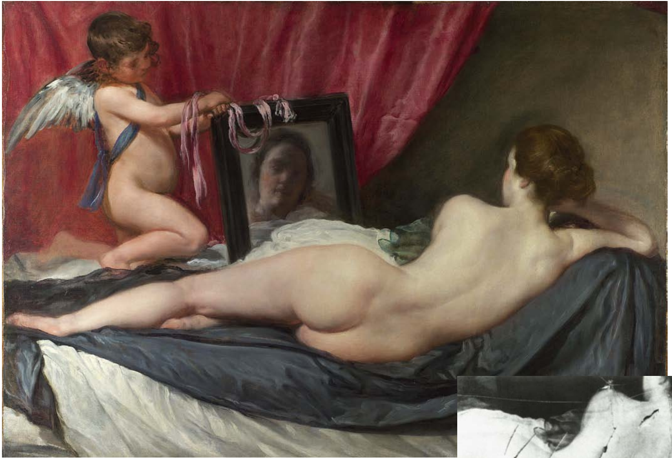
La Venus del Mirall, el quadre del pintor Diego Velázquez. A la dreta, detall dels talls realitzats per la sufragista Mary Richardson.

tics intents d'agafar-me, va relliscar [...] i vaig tenir un temps extra per assestar quatre ganivetades més al quadre”.