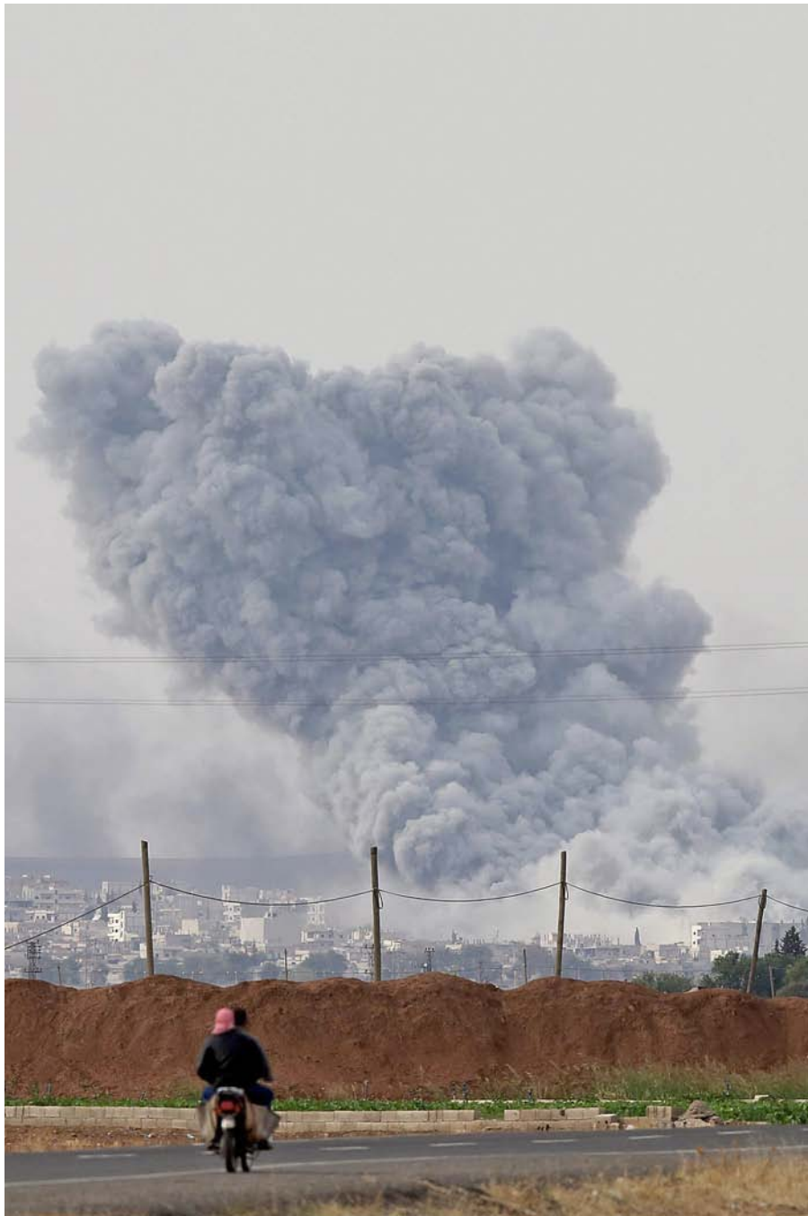
Des de territori turc es poden apreciar els enfrontaments entre el Kurdistan siríà i Estat Islàmic.

→ nous reclutes i genera grups que els tenen com a exemple.