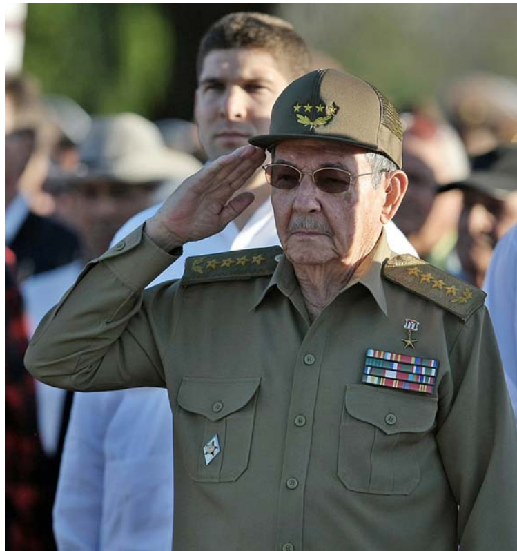
dels Castro a Cuba són dos dels millors exemples de repressió digital al planeta.

bé estan censurats llocs web de bancs, mitjans de comunicació qualificats com a hostils, portals de contingut pornogràfic, pàgines de grups opositors al règim i organitzacions en defensa dels drets humans. Els anomenats Guardians de la Revolució controlen el proveïdor d'accés gràcies al seu gran aliat: la Companyia de Telecomunicacions de l'Iran. Tot queda a casa.