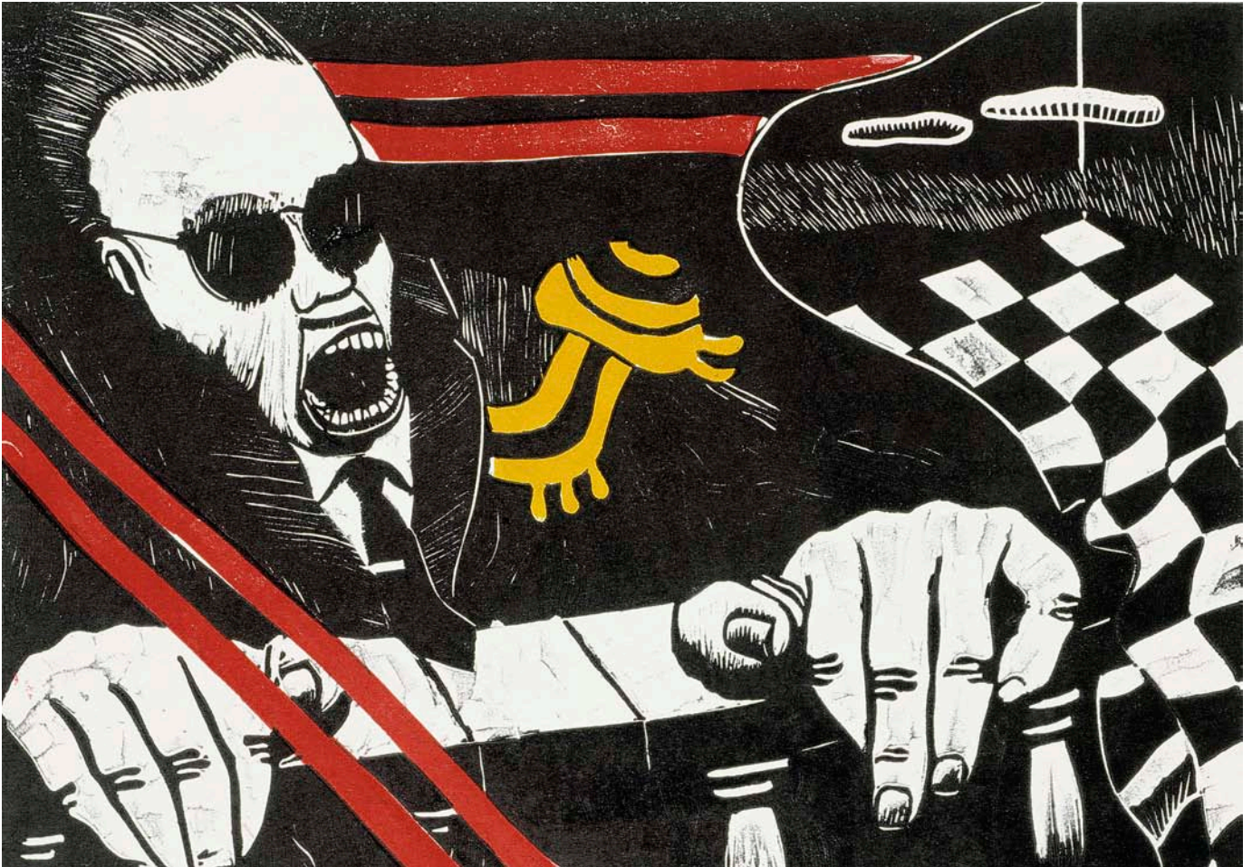
El dictador (1975). Rafael Calduch.