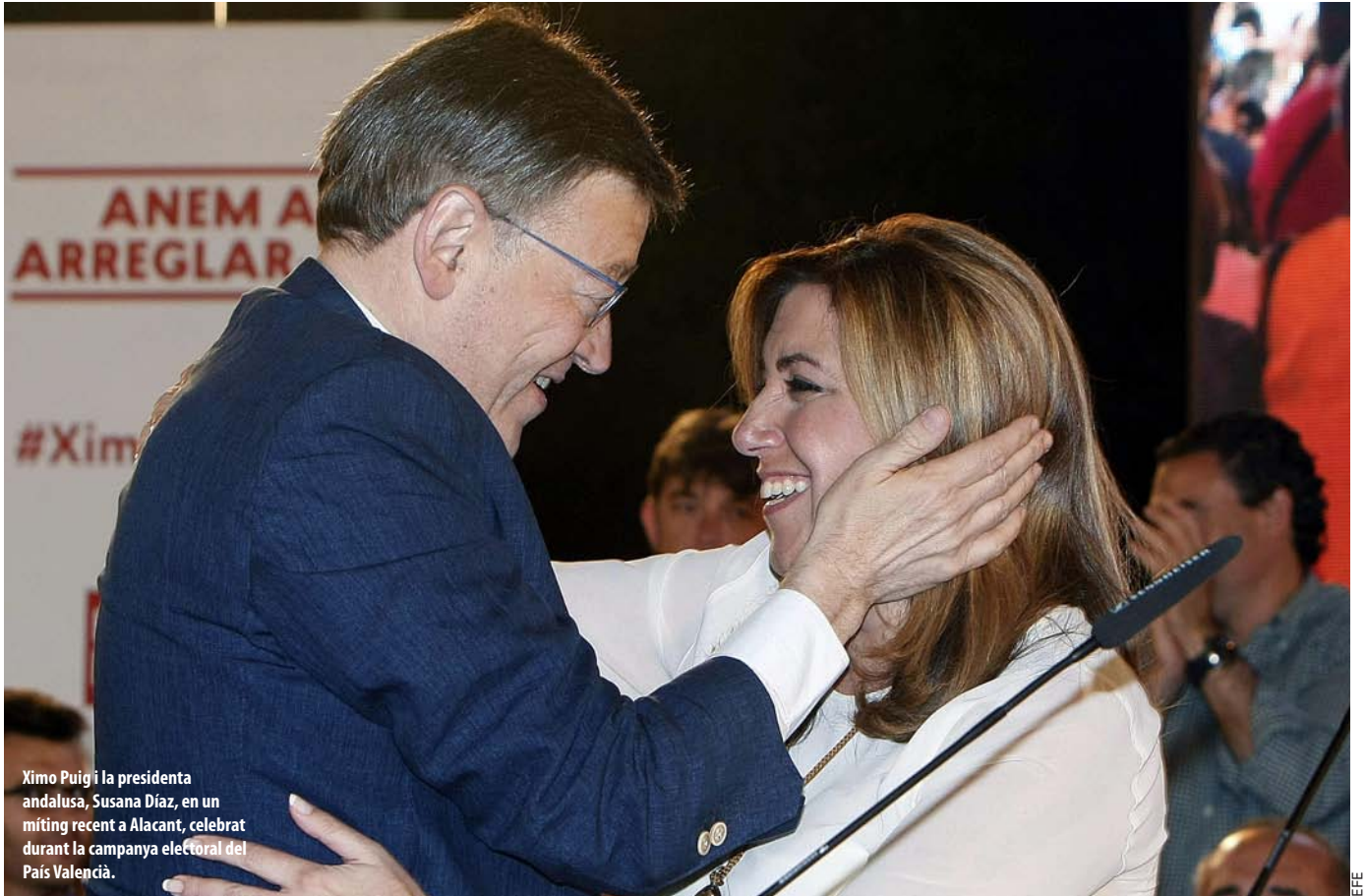
Ximo Puig i la presidenta andalusa, Susana Díaz, en un miting recent a Alacant, celebrat durant la campanya electoral del País Valencià.