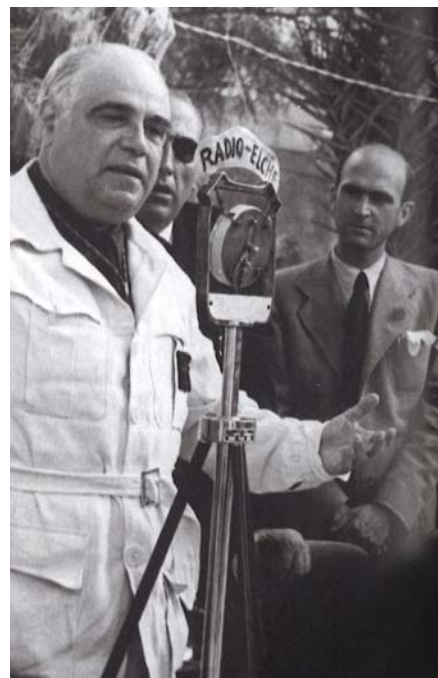
NATACIÓ I MISTERI D'ELX. A la pàgina 70, D'Ors en una imatge sense datació, probablement a Itàlia, amb un amic desconegut. Sobre aquestes línies, l'any 1940, a les festes del Misteri d'Elx, una tradició que fascinava l'intel·lectual.

El ben cert és que l'any 1921 abandona el català com a llengua d'expressió. I dos anys més tard s'estableix a Madrid i comença a escriure un Glosario al diari ABC . D'Ors és ben rebut a Madrid, però mai no serà el referent intel·lectual de gran magnitud en què s'havia convertit a Catalunya. El català té defensors, però també detractors. I relacions que es deterioren. Un dels grans referents de la intel·lectualitat espanyola del moment, José Ortega y Gasset, que en algun moment ha elogiat el Glosario com “uno de los hechos más importantes de las letras españolas contemporáneas”, acaba distanciant-se. Com explica Jordi Gràcia en un apartat dedicat a la relació entre ambdós intel·lectuals, Ortega no comparteix la sintonia d'Ors amb l'autoritarisme antidemocràtic, en el qual ha aprofundit en les seues estades a França. Al madrileny, a més, li resulta cada vegada més difícil establir un debat amb Ors, algú que “no dialoga nunca. Su manera de combatir es volverse de espaldas al enemigo y cantar una vez más su aria”. Com ara, tampoc no combrega amb la visió orsiana de la cultura europea. Cap al 1924, l'antipatia mútua és manifesta. Potser això explica que al diari El Sol , on Ortega col·labora assí-