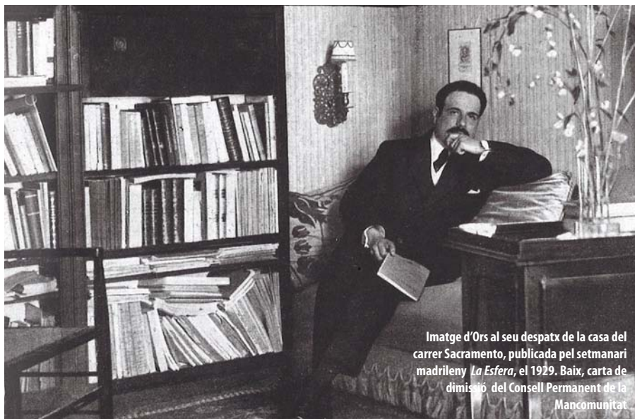
Imatge d'Ors al seu despatx de la casa del carrer Sacramento, publicada pel setmanari madrileny La Esfera , el 1929. Baix, carta de dimissió del Consell Permanent de la Mancomunitat.

Comptat i debatut, Eugeni d'Ors. Potència i resistència (títol que fa referència a una de les gloses, escrita el 1911: “(...) Aixís, la filosofia de l'Home qui Treballa i qui Juga no pot ésser monista: ha d'ésser dualista, i formar una imatge del món en què apareguin lluitant la Potència i la Resistència o, en altres termes, el Bé i el Mal-o, en altres termes, l'Esperit i la Matèria-o, en altres termes, l'Albir i la