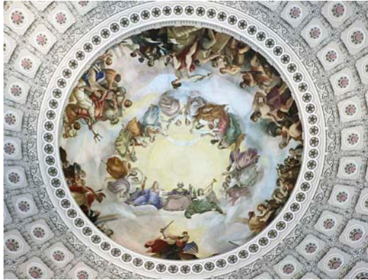
L'Apoteosi de Washington al fresc del Capitoli. A la dreta, Dylan Roof.