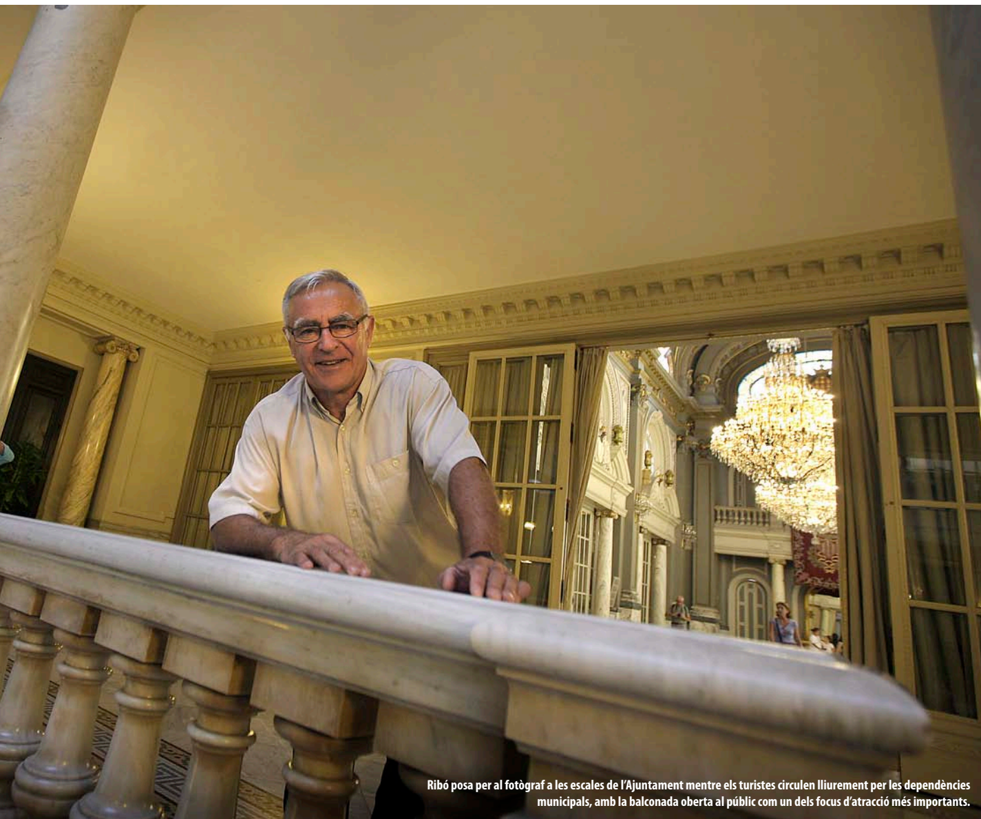
Ribó posa per al fotògraf a les escales de l'Ajuntament mentre els turistes circulen lliurement per les dependències municipals, amb la balconada oberta al públic com un dels focus d'atracció més importants.

Ribó ha ajudat Mónica Oltra. És una simbiosi bastant perfecta perquè tenim un tarannà distint, maneres d'afrontar la realitat prou diferents, i els resultats a la ciutat de València han estat molt paral·lels. Hi ha una diferència de mig punt, menys de mil vots. Crec que ha estat una bona simbiosi.