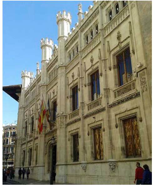
Les majories d'esquerres també s'hauran d'haver forjat a la resta de principals institucions, com ara l'Ajuntament de Palma (esquerra) i els consells insulars (a la foto el de Mallorca).

supera el 17%– és sòlid. Ho demostra també que mentre Podemos queda en vot autonòmic a tot l'estat –vegeu quadrat– a 12,9 punts percentuals per sota del PSOE de Sánchez, a les Illes Podem només està a 3,4 del PSIB.