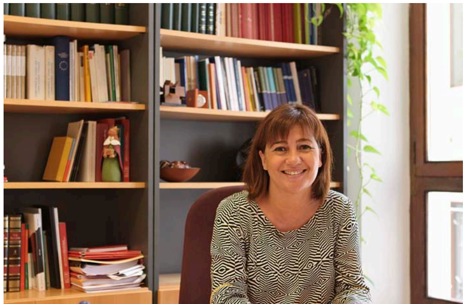
Francina Armengol no veu cap problema a governar en minoria mentre ella sigui la presidenta del Govern.

A quest dissabte 13 de juny és el dia previst per la normativa per constituir els nous ajuntaments, amb els regidors electes el passat 24 de maig. La negociació dels partit d'esquerra per fer majoria a l'ajuntament de Palma ja estava gairebé tançada a finals de la setmana passada, amb