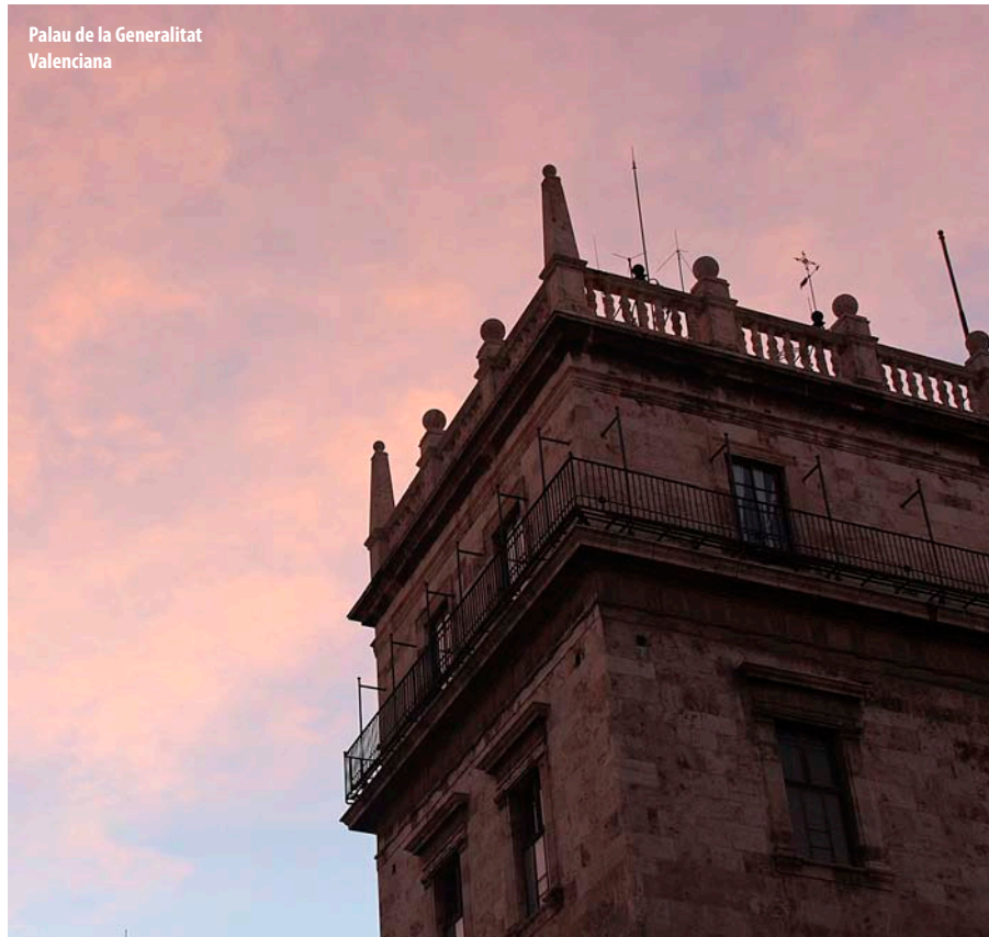
Palau de la Generalitat Valenciana

→ del país? Al capdavant, els pressupostos anuals són l'arma de què disposen els governs per desplegar les línies mestres de la seua política. EL TEMPS ha calculat, a partir de les dades del Ministeri d'Hisenda, la suma dels pressupostos de les institucions que han mudat la seua pigmentació del blau al roig. Per fer-ho s'ha tingut en compte els municipis de més de 10.000 habitants, així com diputacions, consells insulars i governs autonòmics que abans governava el PP i que ara comandaran formacions progressistes. L'any de referència és el 2014, l'últim de què es disposa de dades. La xifra resultant és només orientativa, però dóna idea de la magnitud del canvi que suposa el veredicta ciutadà a les urnes. Ben mirat, no és el mateix desti-