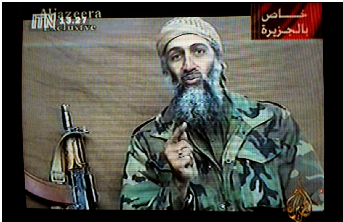
EL GRAN LÍDER. Osama Bin Laden, el gran líder de l'organització Al-Qaida, feia sermons religiosos d'una hora per captar nous combatents per a la gihad, a diferència de l'estratègia de captació que segueix Estat Islàmic.