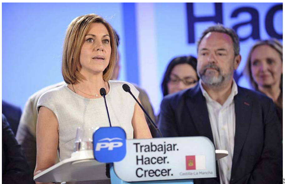
Els partits de l'esquerra estan en disposició de fer fora del govern de Castella-la Manxa María Dolores de Cospedal.

L'altre gran beneficiat de la nit electoral és Podem. Amb poc més d'un any de vida, els dels cercles s'erigeixen en àrbitres indispensables del canvi. Amb les seues diverses marques blanques,