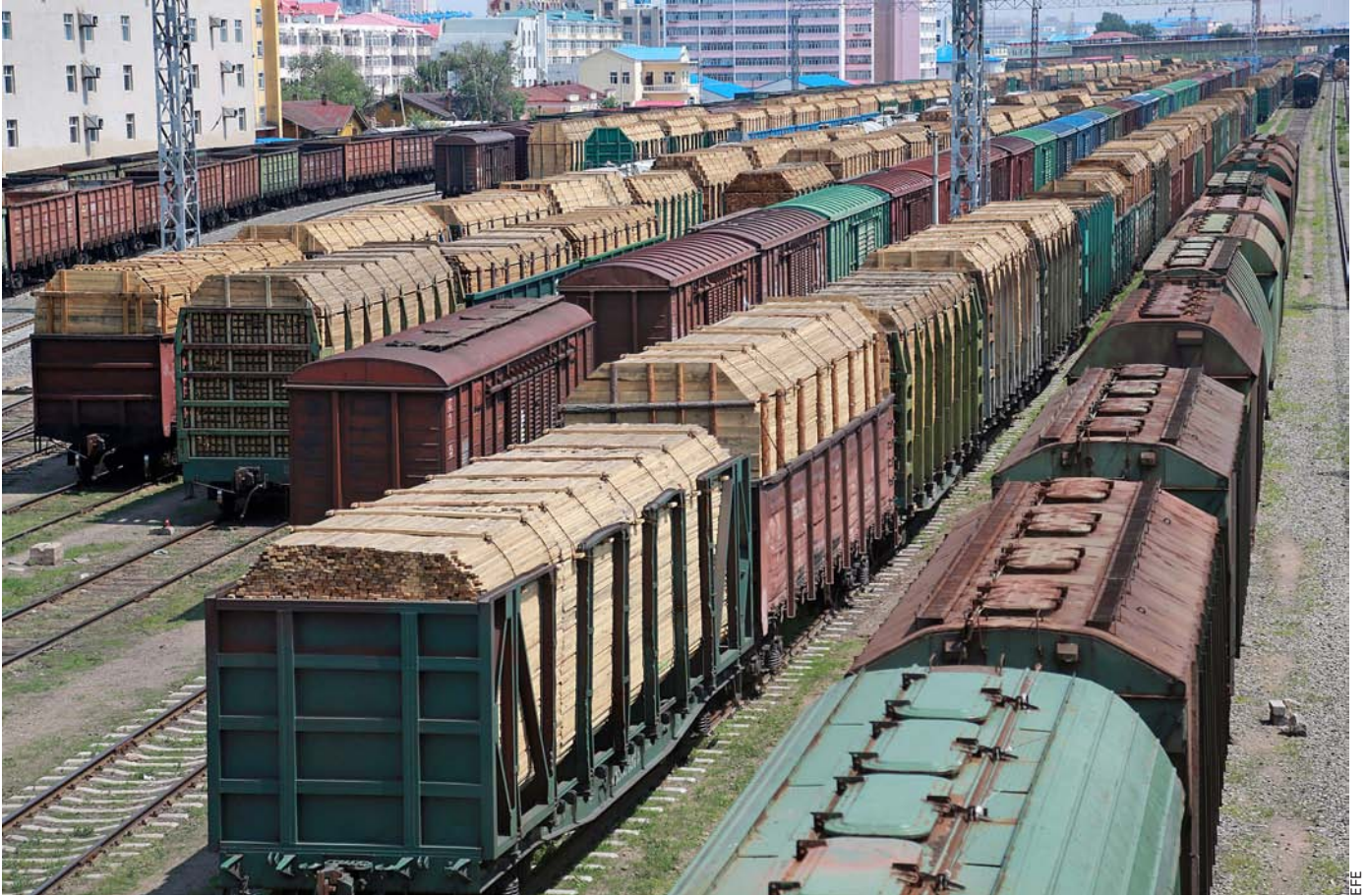
Combois de trens aturats a l'estació ferroviària de Manzhouli, a la Mongòlia Interior, en la ruta cap a Rússia.

El gegant asiàtic aspira a estendre els seus tentacles econòmics cap a l'oest per terra i mar. Per això ha llançat l'estratègia "Un cinturó, una ruta", amb la qual persegueix teixir una extensa xarxa de transports, comunicacions i infraestructures que la unisquen amb Àsia Central, Orient Mitjà, Rússia i, molt especialment, Europa. Es tracta d'una aposta estratègica destinada, en última instància, a canviar la geopolítica mundial per la via de la influència econòmica.