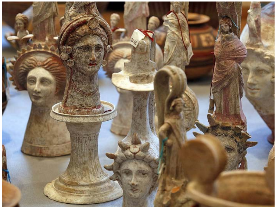
Mostra de les 5.000 antiguitats recuperades del magatzem del traficant d'art Gianfranco Becchina –"la confiscació més gran de la història–, exposades a les Termes de Dioclecià, dependents del Museu Nacional de Roma.

(lladres de tombes) van pagar excavacions al cementiri d'herència cultural mundial de Carveteri. Van robar a Pompeia i a les ruïnes de Siracusa i Tàrent, on fa 2.700 anys van arribar uns pobladors grecs que van deixar una herència extraordinària de temples i tombes de joies.