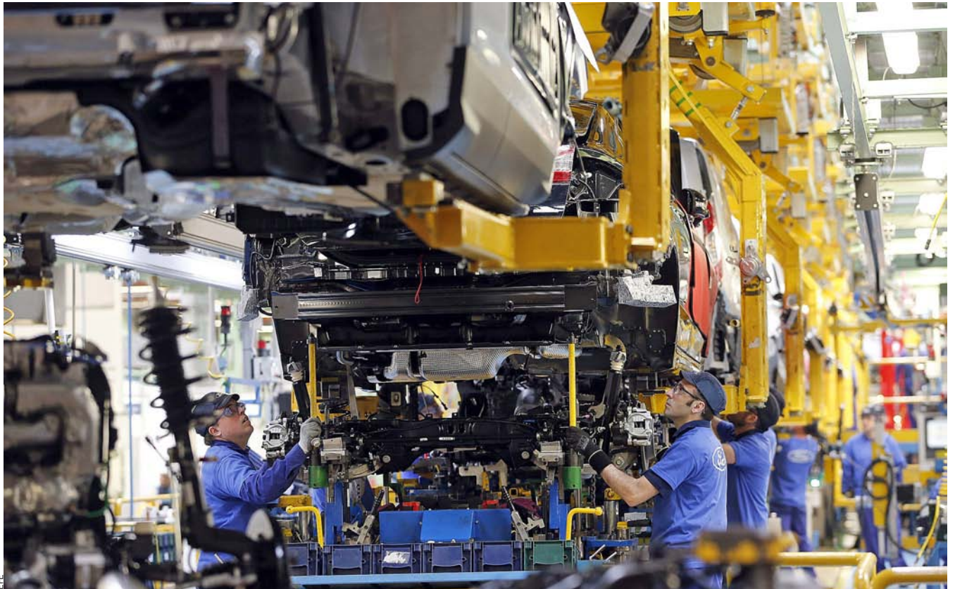
La indústria de l'automòbil figura entre les que estan tenint un comportament més bo en els darrers trimestres. A la imatge, la factoria Ford d'Almussafes.

tèxtil a tot l'estat va situar-se per sota dels 200.000, quan en altres èpoques va enregistrar pics de 400.000. Al País Valencià, segons Comissions Obreres, s'han destruït 15.000 llocs de treball relacionats amb el tèxtil, la majoria concentrats a les comarques centrals.