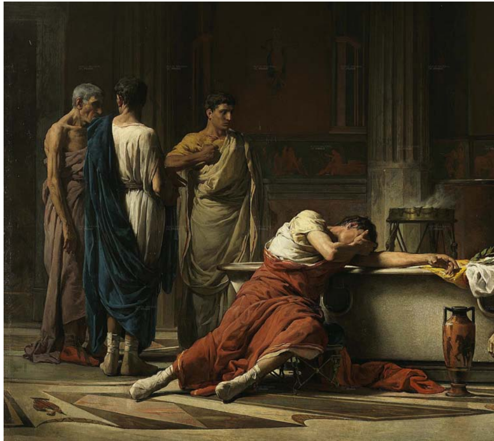
El suïcidi de Sèneca, obra del 1871 de Manuel Domínguez Sánchez.

El professor de la Universitat de Girona Oriol Ponsatí-Murlà (Figueres, 1978) acaba de publicar una antologia imprescindible amb títol hamleticà, O no ser (Edicions de l'Ela Geminada, 2015), que recull una vintena llarga de textos filosòfics (de Plató a Cioran, passant per Hume, Kant, Diderot o Hegel) sobre allò que Wittgenstein anomenava: “el pecat bàsic”. Qui llegeixi aquest text tindrà