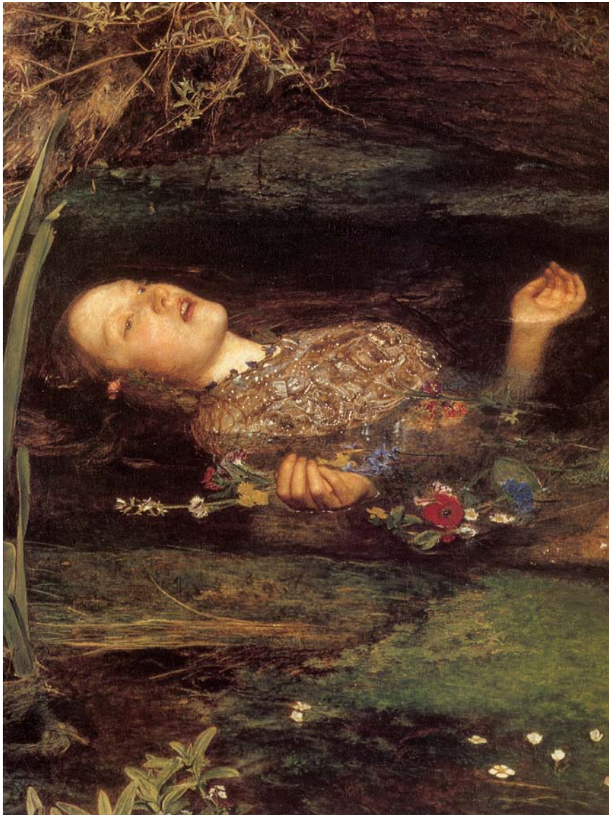
Ophelia , obra de John Everett Millais. A les obres de Shakespeare hi ha un total de 52 suïcidis.

mort més voluntària és la més bella” si és lliure. En les obres de Shakespeare (que va escriure de 1589 a 1613) hi ha 52 suïcidis, de tota mena. Brutus, Cassi, Antoni, Cleòpatra, Romeo, Julieta, Macbeth, Ofèlia, Otel·lo... tots tenen en certa manera un element comú. Són gent desesperada i la seva mort els serveix com a lliçó moral. El suïcidí nihilista en Shakespeare simbolitza també la buidor, que la psicologia de l'època defineix com a melancolia.