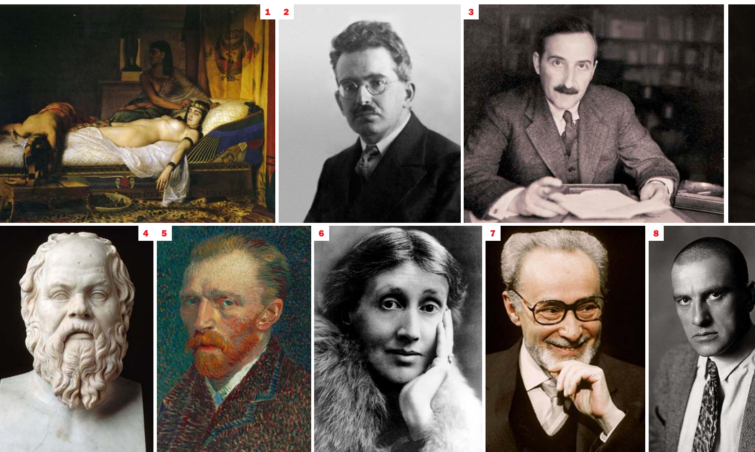
Galeria de personatges històrics que es van suïcidar: 1. Cleòpatra 2. Walter Benjamin 3. Stephen Zweig 4. Sòcrates 5. Vincent Van Gogh 6. Virginia Woolf 7. Primo Levi 8. Vladimir Maiakovski

El ressò de l'accident del vol A-320 de Germanwings i l'estranya personalitat d'Andreas Lubitz ens porten a reflexionar sobre la història i la (impossible?) justificació moral del suïcidi. Un article del filòsof Ramon Alcoberro.