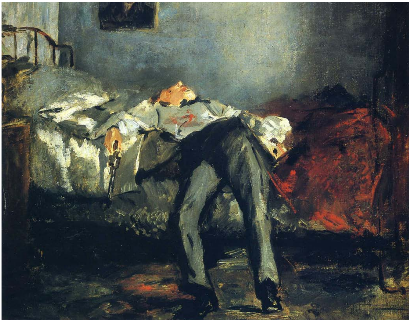
Le suicidé, d'Edouard Manet, una altra reproducció artística d'un tema universal.

conseqüència de la desorientació que ens produeix la vida mateixa quan ens canvien les normes). Assumim, amb el darrer Freud, que en les forces inconscients hi ha tant libido (força eròtica) com destrudo antivital. Per al psicoanalista vienès, la vida s'empobreix si no es pot posar en risc. Com més creix l'ordre i la repressió social, més creix també el desig de destruir-ho tot. El suïcidi correlaciona bé amb la falta d'expectatives. A l'Estat espanyol, no es va suïcidar ningú durant el llarg període de l'agonia de Franco l'any 1975 i, en canvi, els anys amb més suïcidis registrats van ser entre 1940 i 1943, per causes òbvies.