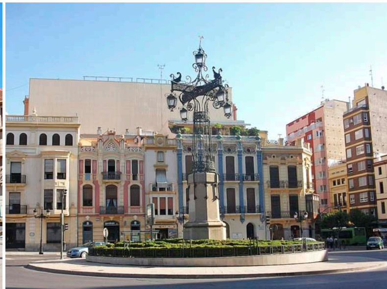
Sòria (esquerra) i Castelló (dreta) són la cara i la creu de la crisi; l'una ha estat la millor a l'hora de resistir el daltabaix econòmic; l'altra ha estat la més vulnerable.