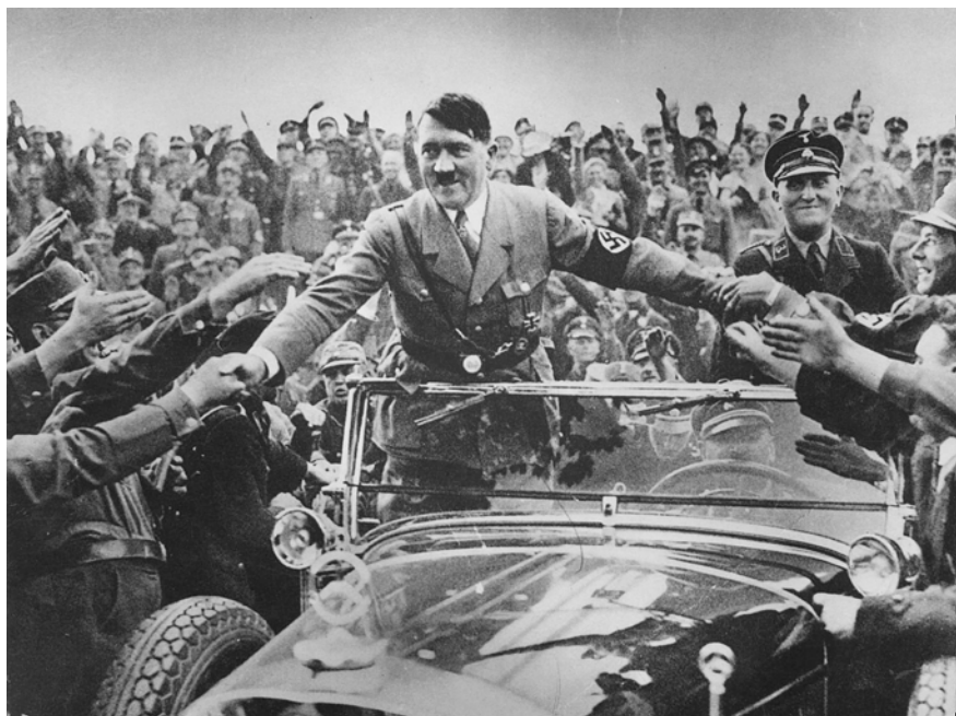
Hitler va començar a escriure Mein Kampf a la presó el 1924, però no l'acabà fins l'any següent, quan n'edità el primer volum, mentre que el segon hagué d'esperar fins al 1928.

Proscripció. Acabada la Segona Guerra Mundial, les autoritats aliades que ocupaven Alemanya proscrigueren el llibre. Posteriorment, tant la República Federal –la banda occidental del país que s'organitzà en Estat democràtic– com la República Democràtica –la zona oriental, on els soviètics crearen una dictadura comunista autòctona– mantingueren la prohibició d'editar-lo de bell de nou. Els dos governs alemanys es convertiren en els hereus dels béns dels jerarques nazis que havien estat expropiats anteriorment per les autoritats d'ocupació mitjançant les directives legals a posta emeses el 1946 i 1948. L'executiu federal trans-