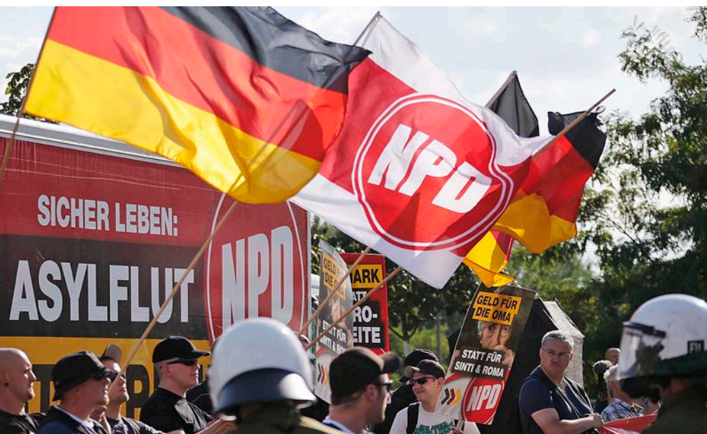
Les autoritats alemanyes temen que si s'allibera l'edició de Mein Kampf no sigui un revulsiu que afavoreixi els moviments neonazis.

també es donà permís per a una edició en espanyol l'any 1937.