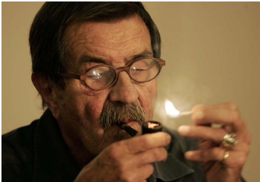
En atorgar-li el premi Nobel de literatura, l'Acadèmia sueca va dir que "amb faules extraordinàries Grass ha dibuixat la cara oblidada de la història".

>> avançada, no m'havia semblat pas que estigués tou o malalt. D'altra banda, en aquestes converses, sovint vaig sentir que es trobava en un punt en què ho havia aconseguit tot: tot estava dit. Tot estava escrit".