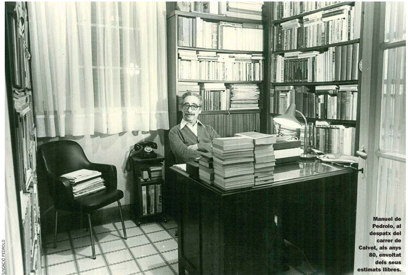
Manuel de Pedrolo, al despatx del carrer de Calvet, als anys 80, envoltat dels seus estimats llibres.