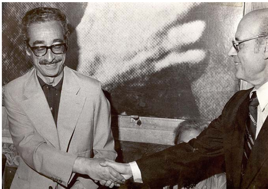
Manuel de Pedrolo, en rebre el Premi d'Honor de les Lletres Catalanes l'any 1979. A l'acte, hi assistí Vicent Andrés Estellés, guardonat el 1978.

“Un corpus enorme d'una obra que abraça tots els gèneres, una manera de fer que mostra que gairebé tot és narrable, que crea atmosferes, personatges, situacions en un moment on tot estava per fer”, afegeix, abans de destacar un altre aspecte del seu llegat literari, “l'ús que fa de les diferents tècniques narratives per retratar la condició humana, en una recerca incansable d'investigació”. “Crec que cal situar Pedrolo dins el lloc que li pertoca a la història de la literatura catalana, tornar a reeditar les seves obres més reeixides i, en definitiva, difondre'l més”, conclou Moreno, defensora també del tarannà de Pedrolo com a “creador d'opinió, contrari a qualsevol cotilla, un independentista que vol trencar els límits i les opressions de tot tipus, ja sigui socials, polítiques, nacionals o de raó sexual”.