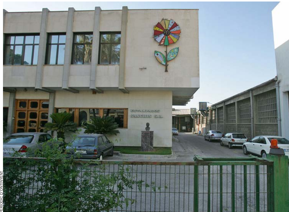
Vidal y Sanz, fabricant de mantes d'Ontinyent, va tancar les seues portes el 2012. Avui, les seues

Spanair, Corporación Dermoestética, editorial Moll, Colortex, Orizonia... La recuperació econòmica comença a albirar-se però la crisi deixa darrere seu una llarga llista de cadàvers. EL TEMPS fa un recompte de les víctimes més notòries que han caigut fruit del daltabaix econòmic.