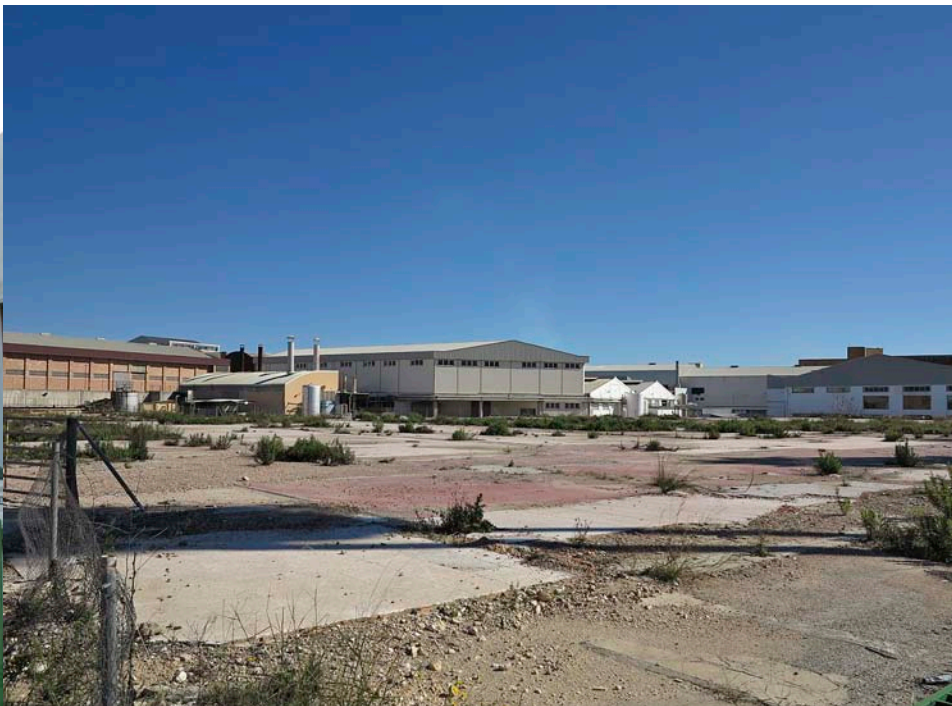
instal·lacions han estat arrasades.

catalana a Ses Illes. La crisi del sector, unida a les despeses derivades del canvi de seu, la caiguda de les vendes del Diccionari Català-Valencià-Balear després d'una nova i costosa edició i la manca de suport públic foren els factors que desencadenaren la fallida d'aquesta empresa de petites dimensions però d'ampli prestigi que va fundar l'any 1934 Francesc de Borja Moll.