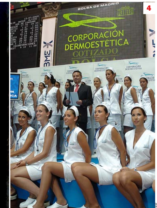
tancament de Tradema va afectar tota l'economia de la comarca del Solsonès. 4. Corporació Dermoestética ha estat l'última gran firma a caure.