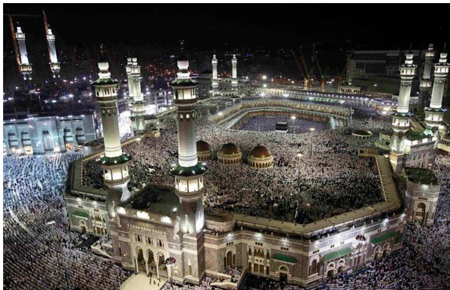
De mitjan anys 50 a mitjan anys 70, la constructora de la família Bin Laden va reformar la Gran Mesquita de la Meca i va utilitzar tones de marbre de Carrara.

Carrara i els Bin Laden. L'estiu passat, per primer cop a la història, una empresa estrangera entrava al negoci