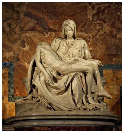
La Pietat de Miquel Àngel està feta amb marbre de Carrara, el material preferit de l'artista florentí.

del marbre de Carrara. CPC comprava per quaranta-cinc milions d'euros el 50% de l'empresa Marmi Carrara, que té la concessió d'aproximadament un terç de les excavacions dels Apuans. CPC pertany a la constructora més gran del món, Saudi Binladin Group (GSB), creada pel pare d'Osama Bin Laden i actualment propietat dels germans i cosins de l'artífex de l'atemptat de les Torres Bessones. Cal dir, però, que la família va apartar i desheretar Osama l'any 1994, és a dir, set anys abans de l'atac.