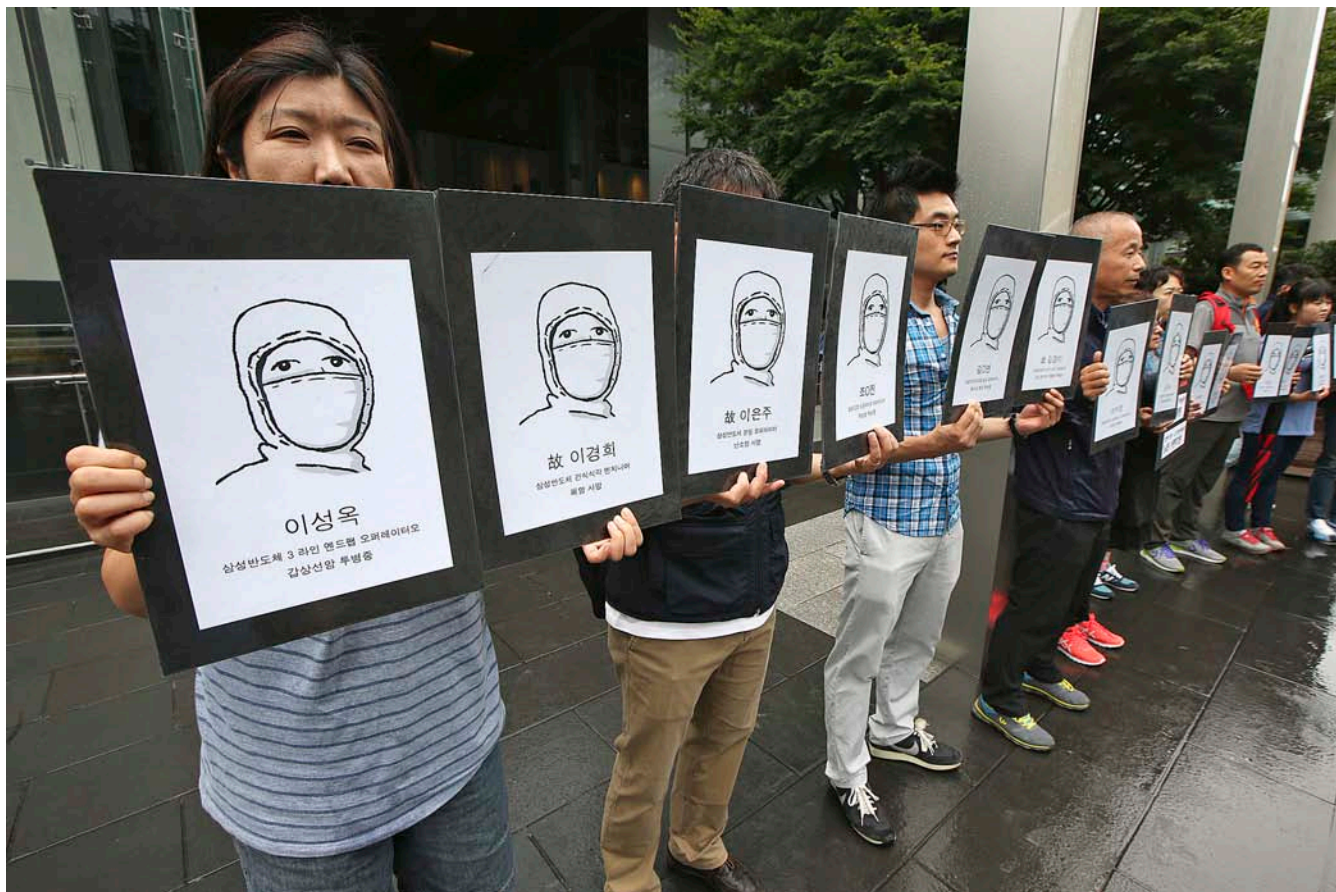
Manifestació pel tractament que ha fet Samsung de les morts i malalties dels seus treballadors, davant de la seu de l'empresa a Seül.