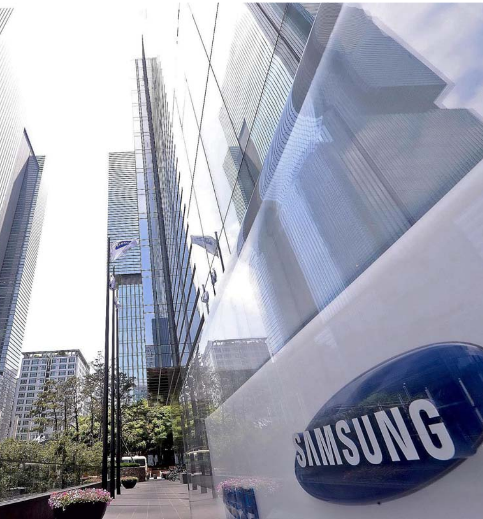
presa. Des dels anys 90, uns 196 empleats han agafat malalties greus com ara leucèmia, tumors cerebrals o esclerosi múltiple.