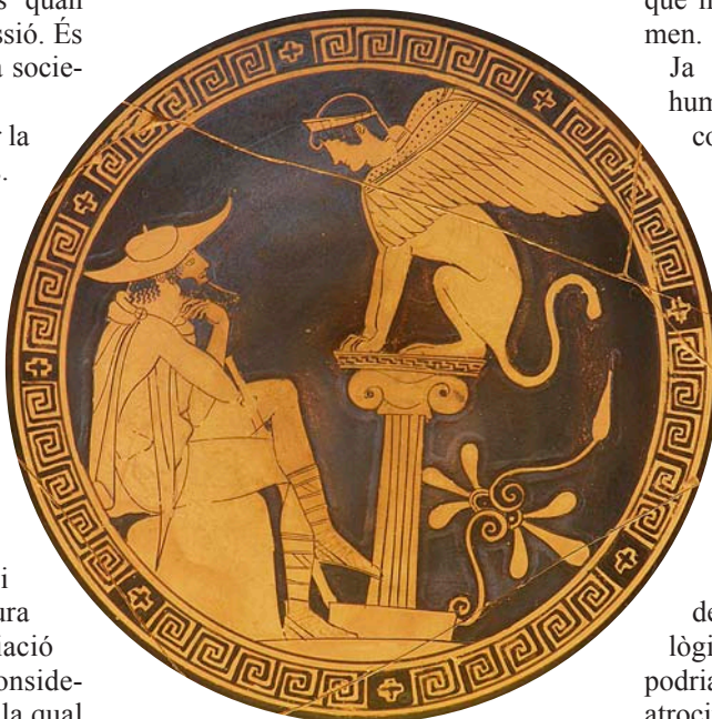
Els mites tendeixen a eliminar la part malvada dels personatges, com Èdip.

Així es cau aviat en una paradoxa: és que l'anomalia, respecte al que és normal, no rau ja en el mateix delictes? Qui mata, està malalt, perquè matar no hauria de ser normal en l'home. Qui mata molta gent, estaria, doncs, considerablement malalt i no en seria gaire culpable. En altres paraules: un assassí en sèrie és la prova de la seva innocència. Està malalt, lògicament. Llavors, ni tan sols es podria responsabilitzar Hitler per les atrocitats que va cometre. Això no pot ser. La malaltia no demostra ni perdona res. És per això que als assassins i als