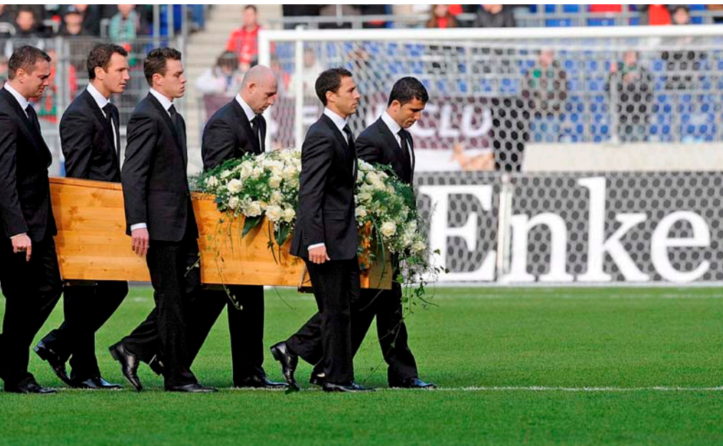
Després del suïcidi del futbolista Robert Enke, van arribar les imitacions. Els dos anys següents es van tirar al tren cada setmana dues o tres persones més que abans.