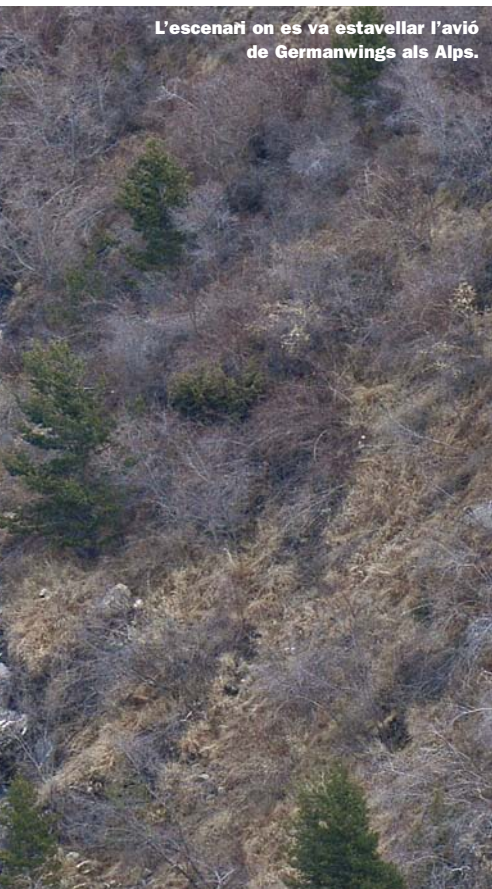
L'escenari on es va estavellar l'avió de Germanwings als Alps.

de la culpabilitat. Però ara, després d'aquesta frase, es tracta altra vegada d'Andres Lubitz. Tenia la possibilitat d'escollir un camí contrari al de l'accident?