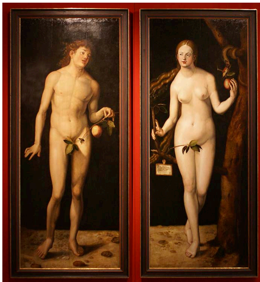
Eva sabia que collir la poma estava prohibit però ho va fer igualment i, segons l'Església, va condemnar tota la humanitat sencera i per sempre.

El periodista Dirk Kurbjuweit signa aquest assaig sobre Lubitz i la culpabilitat, la responsabilitat d'un malalt i sobre com aquest debat ha anat evolucionant al llarg dels segles. Aquell que era un malvat a les novel·les del XIX ara podria ser un malalt mereixedor de compassió?