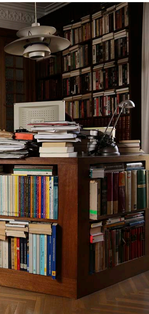
segons la temàtica: ultradreta, guerrilles...

—S'utilitzen aquests grups com a element antiterrorista essencialment. A