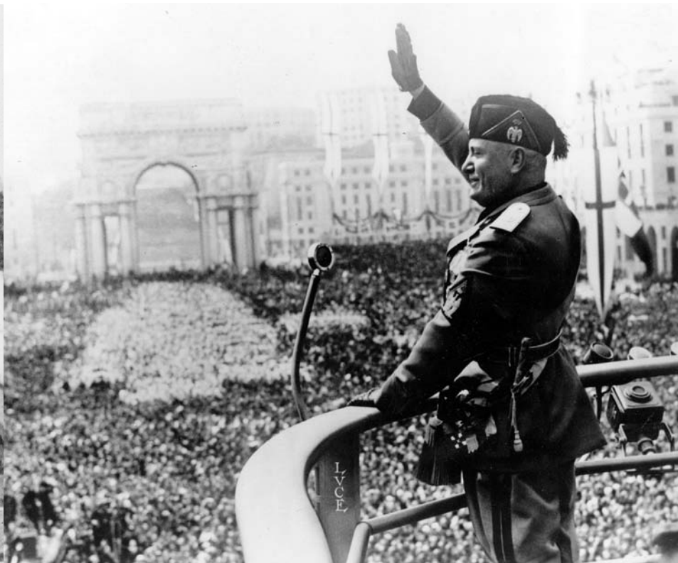
el seu posat encisaven moltes dones.

Mundo el 2009 el britànic Ian Kershaw, autor de vuit estudis sobre el Führer i el nazisme: “Era un misogin a qui li agradava envoltar-se de noies, sobretot si eren molt joves”.