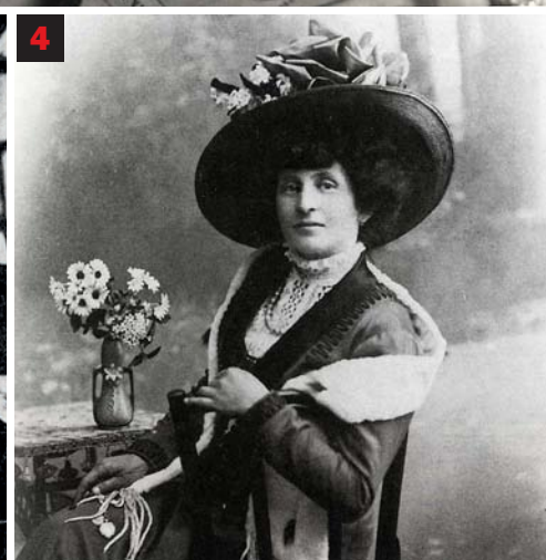
1. Rachele Guidi, esposa tota la vida i després vídua oficial de Benito Mussolini. 2. Clara Petacci, la dona que s'enamorà tant de Mussolini que preferí morir amb ell que continuar vivint. 3. Margherita Sarfatti fou la gran obsessió de Mussolini abans d'arribar al poder. 4. Ida Dalse, la primera esposa de Mussolini, la qual s'atrevis a deixar-lo, i ho pagà car.

casa. Les seves inquietuds artístiques i polítiques la portaren a escriure sobre art a l'òrgan del Partit Socialista, Avanti! El 1912 funda La Difesa delle Lavoratrici —"La defensa de les treballadores"— una revista feminista. El mateix any conegué Mussolini, del qual s'enamorà immediatament. Es convertiren en amants. Junts caminaren ideològicament des de l'activisme d'esquerra al d'ultradreta. El 1918 ella ja era col·laboradora habitual d' Il Popolo d'Italia , periòdic fundat pel Duce el 1914 i que va ser el portaveu dels Fasci Italiani di Combattimento creats