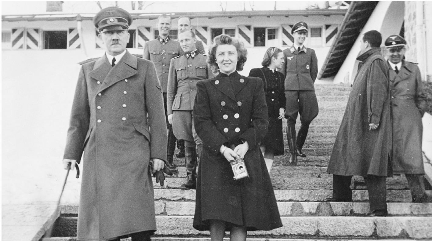
Adolf Hitler i Eva Braun, en una foto feta a Berghof, la gran casa alpina de descans del Führer. La magnètica personalitat de Mussolini (a la dreta) i