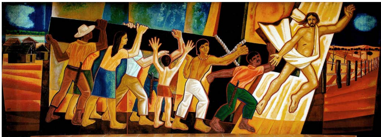
Dalt, mural de São Félix d'Araguaia (Matto Grosso, Brasil). A sota, Helder Camara, que propugnava una Església de la pobresa, i el papa Joan Pau II.