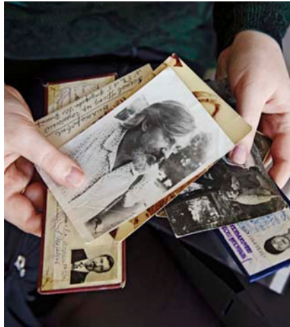
A casa seva, a Finlàndia, guarda records del seu pare i la resta de familiars morts.

Moltes entrades del diari es poden llegir com a perfectes components d'histories curtes; de fet és així com van sorgir, com a narracions que aquesta nena escrivia vertiginosament, coses que havia vist i viscut i que calia que es posessin per escrit abans que quedessin bandejades per la següent història.