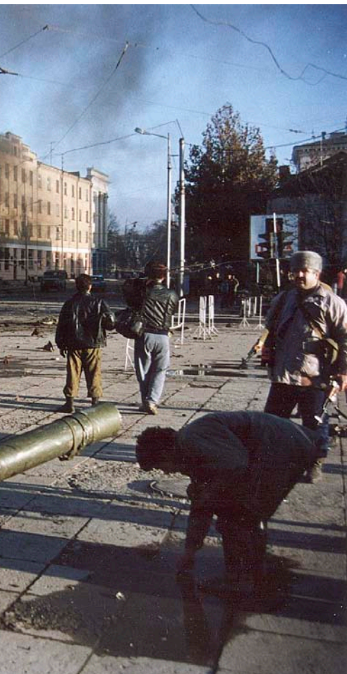
explosions...- es va tornar normal.

llibre aprenia ioga, mirava de meditar. Si no, escrivia. Amb la seva mare, quan estaven soles, podien estar setmanes sense dir-se res, sense sentir cap paraula desagradable. I així escriure es va convertir en una estratègia de supervivència: el diari era l'únic company amb qui podia conversar, l'únic amic, només el paper tenia la paciència que calia per escoltar-la. La resta estaven enfeinats amb si mateixos.