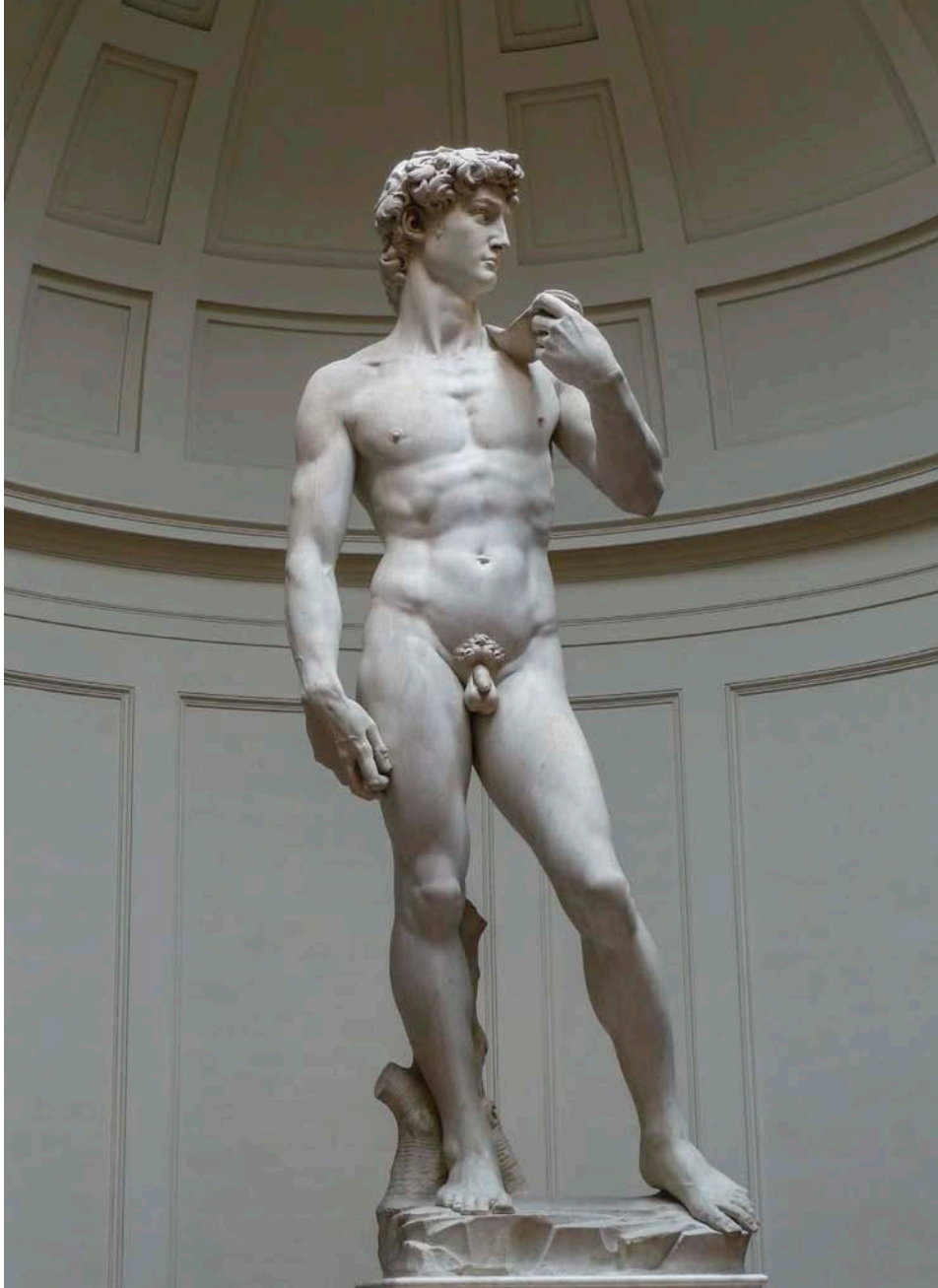
“Tot home neix contaminat”, deia sant Agustí, que considerava el penis la “marca del pecat”.