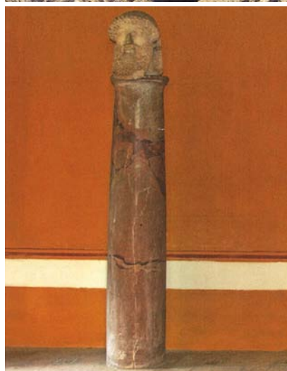
El fal·lus de Hohle Fels és el més antic conegut, amb 28.000 anys. A la dreta, a dalt, un penis esculpit a la muralla d'Empúries. A sota, un hermes, columna coronada amb el cap del déu.

cristianisme. El poema sumeri de Gilgamesh explica, entre moltes altres coses, que el déu Enki va omplir el riu Eufrates (a l'actual Iraq) amb un cop de verga: