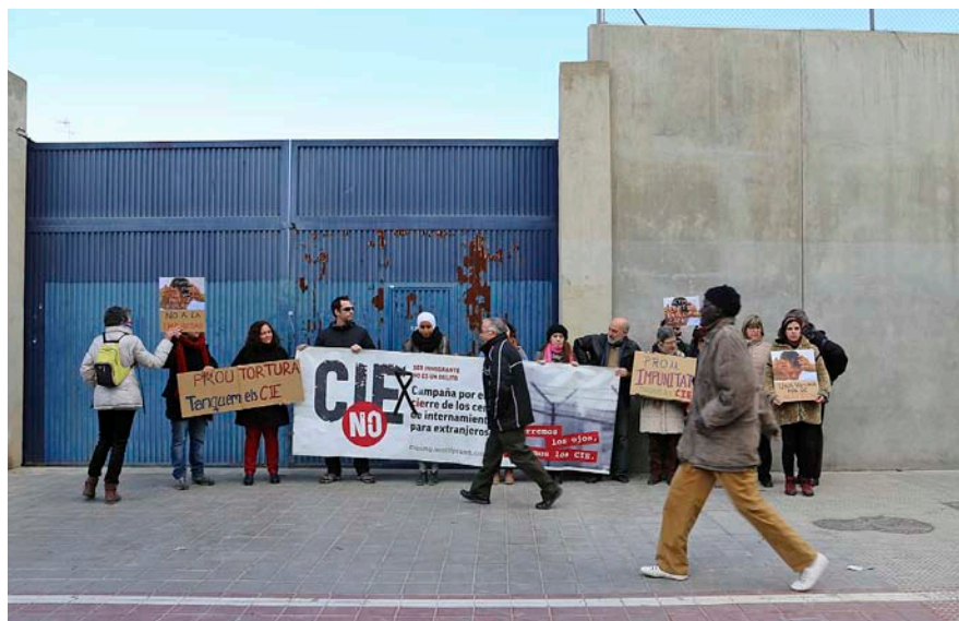
Protesta recent davant la seu del CIE de Sapadors, al barri de Russafa de València.

nen, sense reparar en la desconexió de l'idioma de moltes. A més, mentre les cel·les dels homes sí que es netegen –ni que siga de manera deficient i no continuada–, les dones han de fer-ho elles mateixes. “Els responsables del centre ens va dir que a elles els agrada més així”, s’indigna Verdú.