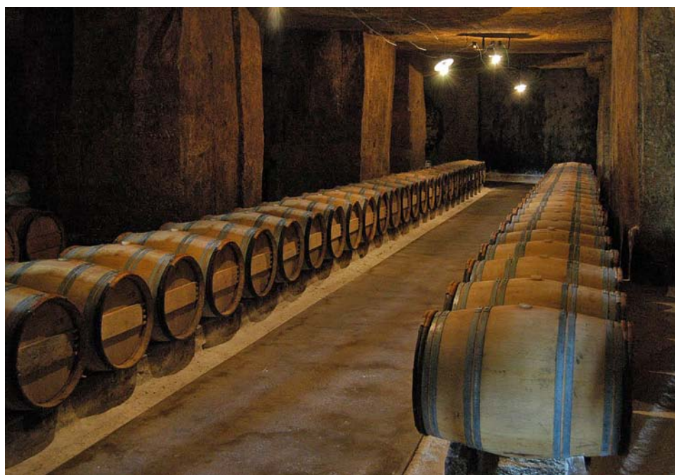
Celler del Château Ausone, a Bordeus.

del millor vi de Bordeus, “literalment, es van fer miques”, digué Vauthier. “Potser, monsieur , això per a vostè és el canvi climàtic”.