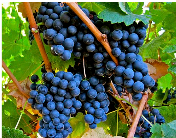
La por del viticultors francesos respecte al canvi és deguda al temor de perdre les típiques connotacions dels seus vins.

i té un fons agitat, però en fi, tampoc hi vol guanyar cap premi. Vol explicar una història i això funciona molt bé en un temps en què el vins biològics estan molt sol·licitats.