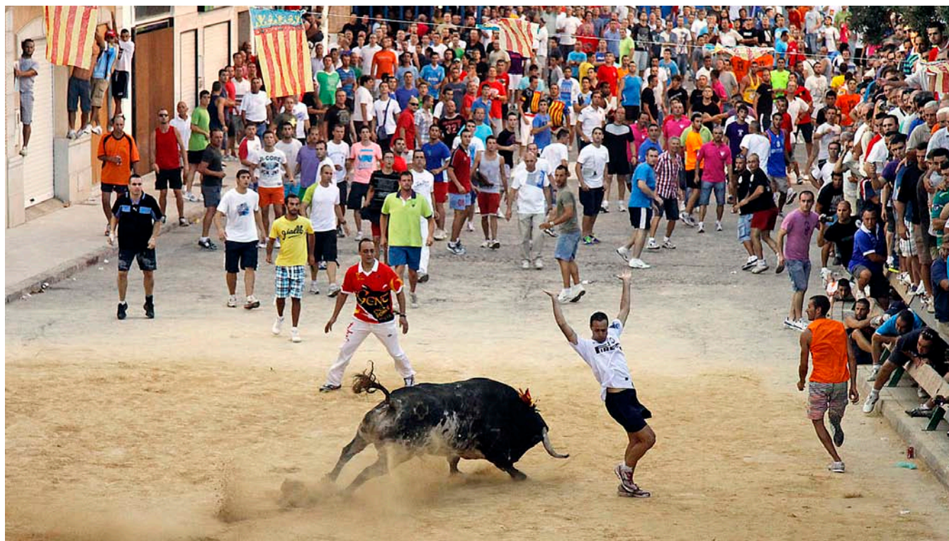
La desencaixonada de Puçol (Horta), que se celebra cada 7 de setembre, és una de les modalitats de bous al carrer amb gran tradició al País Valencià.

ran d'adequar les seues actuacions al ple respecte de la individualitat de la llengua valenciana”.