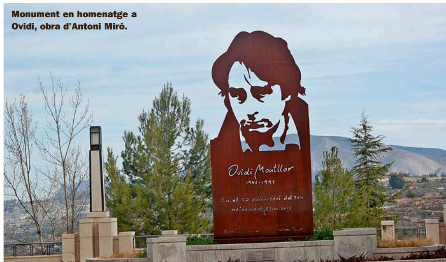
Monument en homenatge a Ovidi, obra d'Antoni Miró.