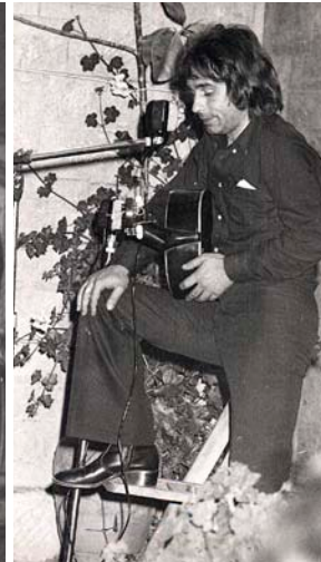
En el sentit de les agulles del rellotge, Ovidi durant la seua etapa als salesians (a la segona filera, el quart per la dreta), amb el seu grup de teatre, amb el seu posat més exhibicionista,

lluita de classes, perquè Alcoi esdevingués fins a la Guerra Civil un important focus anarquista, amb la Confederació Nacional del Treball (CNT) com a organització dominant. Fins al punt que, a l'esclat de l'alçament del general Franco contra el Govern de la República, tota la indústria alcoiana serà col·lectivitzada. “En general, el pes a Alcoi de la CNT té a veure amb una tradició molt radical de la classe treballadora, però també de la burgesia, que al segle XIX era molt esquerrana, molt republicana”, apunta Torró. “Durant la guerra, arribaren a tombar totes les esglésies. I amb les pedres d'una es va construir la piscina municipal”, continua el diputat. “Els anarquistes van fer una repressió molt forta derivada