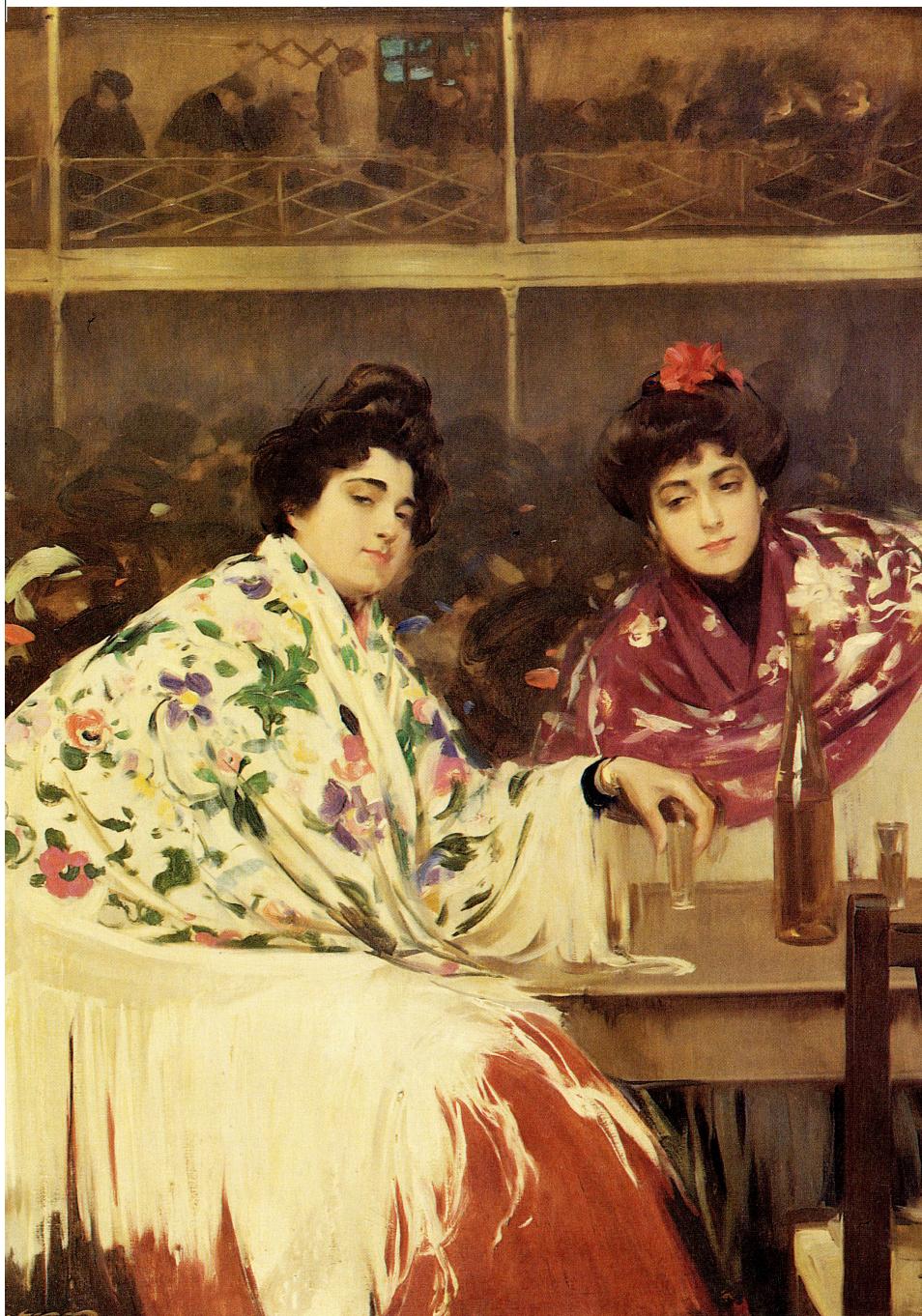
Cafè-concert (1902), de Ramon Casas. Van ser típics al Paral·lel i el Raval fins a la Guerra Civil i Rafael Tasis en recupera la memòria durant la postguerra amb Un crim al Paral·lel , adaptada al teatre com a Paral·lel 1934 .

con notable éxit, una comedia titulada Paral·lel 1934 , de la que la crítica ha hecho elogiosos comentarios”.