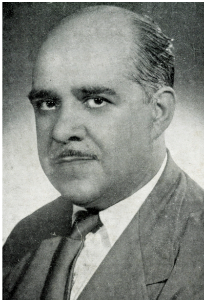
El polifacètic escriptor Rafael Tasis i Març ha estat analitzat a fons com a novel·lista policíac.

La novel·la policíaca catalana entra en escena amb Rafael Tasis. El filòleg Àlex Martín Escribà analitza a fons la inestimable aportació de l'escriptor a la dignificació i popularització del gènere, a casa nostra.