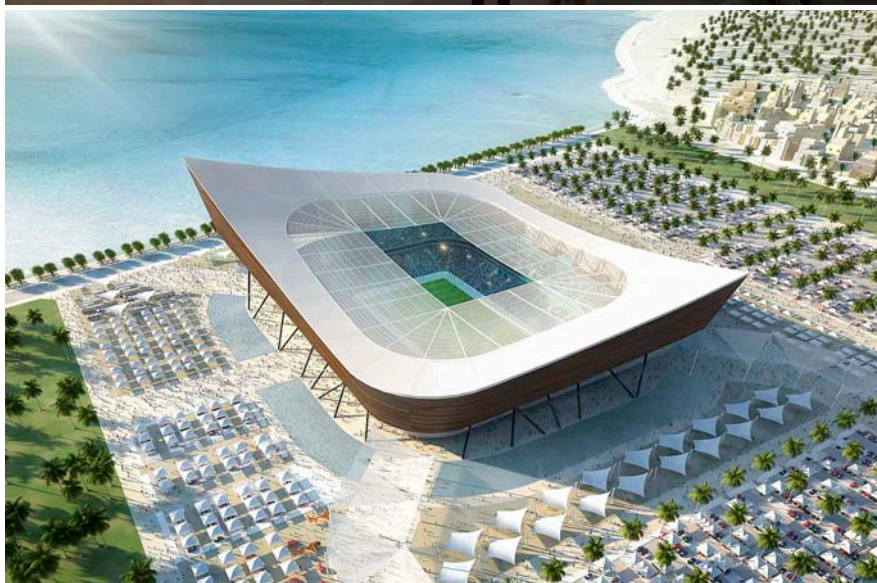
De dalt a baix, estadi d'Al-Gharafa, vila olímpica i pla per a l'estadi que s'ha inspirat en les barques de pesca tradicionals.

que els estadis de futbol són “modernes catedrals”. Vostè ha qualificat els estadis olímpics de “monuments arquitectònics.”