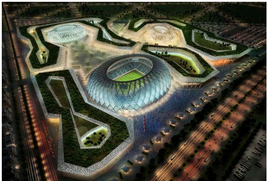
Plans per al complex de l'estadi Al-Wakrah a Doha.