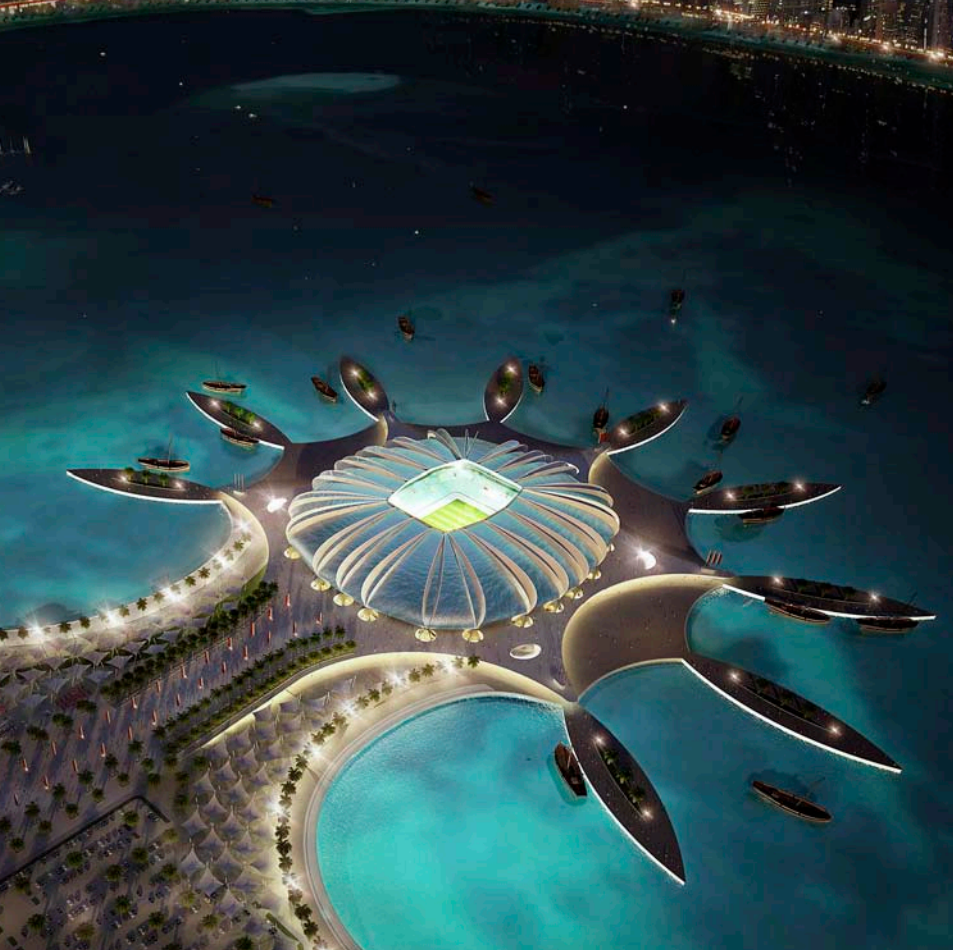
L'arquitecte predilecte de Hitler. A la dreta port-estadi de Doha.

nombrosos i el paper que podem jugar és com més va menys rellevant. I, això no obstant, els únics que estan sempre contra tot són els europeus. La resta del món veu les coses d'una altra manera.