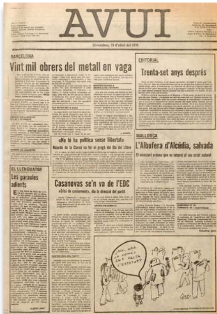
Coberta del primer exemplar del diari Avui, als quioscs el 23 d'abril de 1976, i coberta d'EL TEMPS número zero, que va editar-se la setmana del 4 al 10 d'abril de 1984 a València.