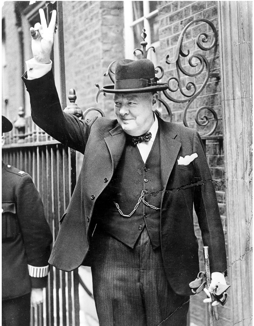
La imatge del liderat que va exercir durant la Segona Guerra Mundial ha tapat els aspectes més obscurs de la seva biografia i ideologia