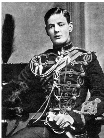
Des de jove fou un entusiasta imperialista, sempre se sentí molt orgullós del seu pas per l'exèrcit combatent per a més glòria de l'Imperi.

Segons les actes de la Comissió Reial per a Palestina de l'any 1937 –moment en què es discutia a Londres el paper del Regne Unit en aquest territori de Pròxim Orient on cada vegada