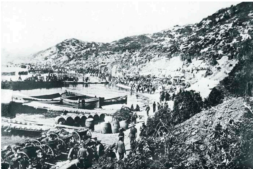
La batalla de Gal·lípoli, saldada amb la derrota britànica i més de 50.000 morts i uns 200.000 ferits, va ser un desastre responsabilitat de Churchill que li podria haver costat la carrera política.

Altres ombres. El paper que jugà a la Segona Guerra Mundial netejà totes aquestes taques a gairebé totes les biografies que posteriorment d'ell s'han escrit. Des d'aleshores és el gran líder britànic que lluità per la llibertat no