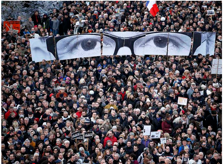
Manifestació en solidaritat amb Charlie Hebdo , a París, després de l’atemptat sofert per la revista satírica.