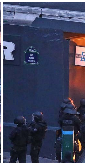
Imatges del segon atemptat contra un supermercat jueu, l'autor del qual era Ahmed Coulibaly.