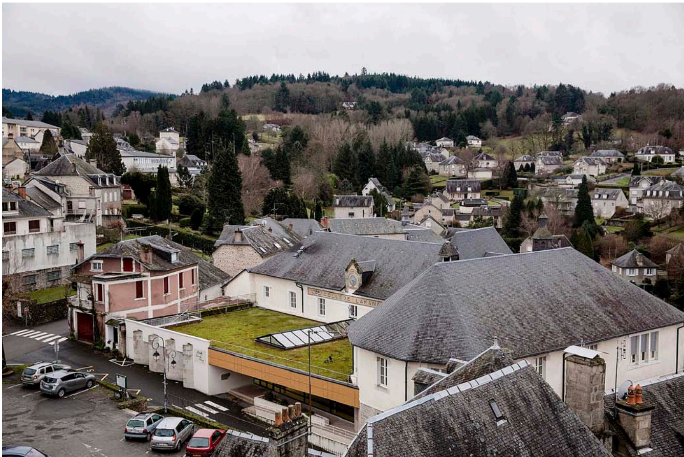
Llar de menors de Treignac on van passar sis anys de la seva infància Chérif i Saïd Kouachi.

ca. Afegeix ràpidament que mai no va fer res especialment dolent, només les entremaliadures infantils habituals.