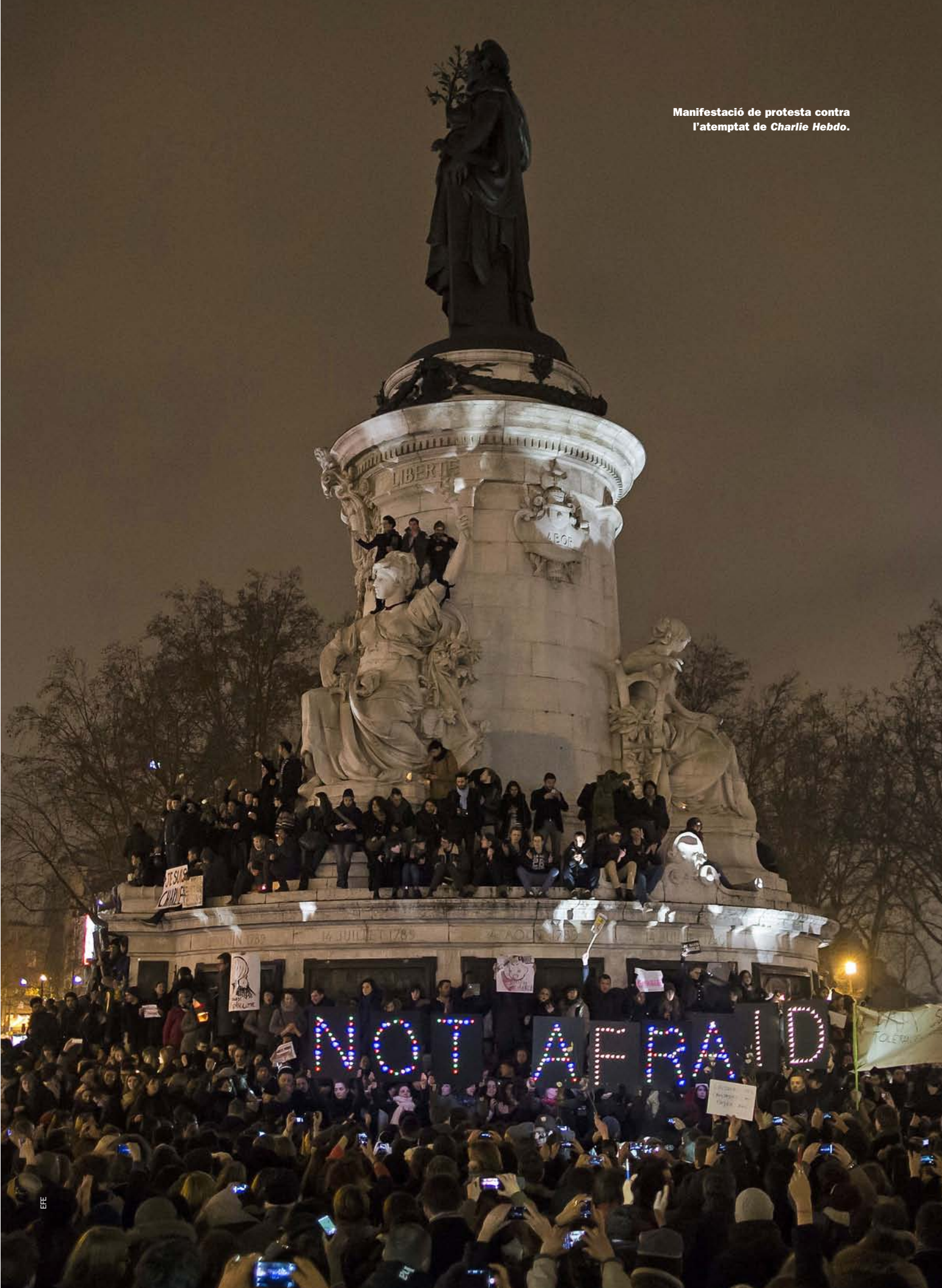
Manifestació de protesta contra l'atemptat de Charlie Hebdo .