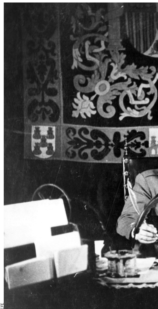
Francisco Franco i Nicolás Franco, al despatx

La primera reacció del Govern de Franco va ser que es presentés davant del dictador, amb el risc que això comportava, per la seva llibertat i potser per la seva vida. Si la primera notícia apareix al Times el 6 de maig de 1937, només deu dies més tard l'ambaixada espanyola de Berlín li truca a Suïssa per dir-li que, segons un telegrama rebut de Salamanca, el cap de l'Estat hi reclama la seva presència. Però no en va fer cas. Al cap d'uns dies, va saber per un ambaixador amic que Nicolás Franco havia engegat contra ell l'apa-