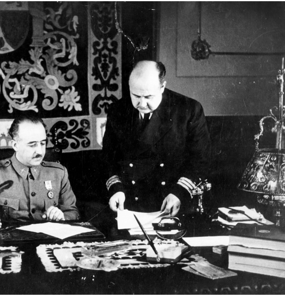
del dictador, a Salamanca, el 1937. Serrat és molt crític amb el germà.

cats també per la premsa republicana, i no citats ni per ell ni per Viñas-, eren “bastant exactes”, tret d’un aparegut només al segon diari. Així, eren exactes tots els altres. Com un de L’Oeuvre , no recollit per la premsa republicana, referent a la impunitat dels falangistes, que, sense autorització ni cap nomenament, envaïen els centres oficials i pretenien ficar-se en els afers importants. Serrat no va saber qui va donar, amb tanta exactitud, la notícia.