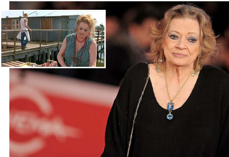
En la fotografia gran, Anita Ekberg, en els darrers anys de la seua vida. I un fotograma de la pel·lícula Bambola , de Bigas Luna.

el seu goig de viure la convertien en una grandiosa criatura, extraterrenal i, al mateix temps, que posseïa una manera de moure's irresistible", reblava.