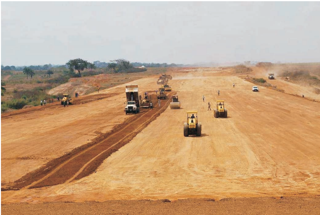
La construcció, el transport i les telecomunicacions comencen a substituir el pes de les mines al PIB d'alguns països africans.

D urant dècades, els preus de les matèries primeres han donat forma al creixement econòmic de l'Àfrica. El continent és l'origen d'un terç de les reserves minerals del planeta, d'una desena part del petroli i produeix dos terços dels diamants. Així doncs, no és estrany que, per regla general, quan els preus dels recursos naturals i els cultius d'exportació han estat alts, el creixement ha estat bo; i quan han disminuït, també ha disminuït l'economia del continent.