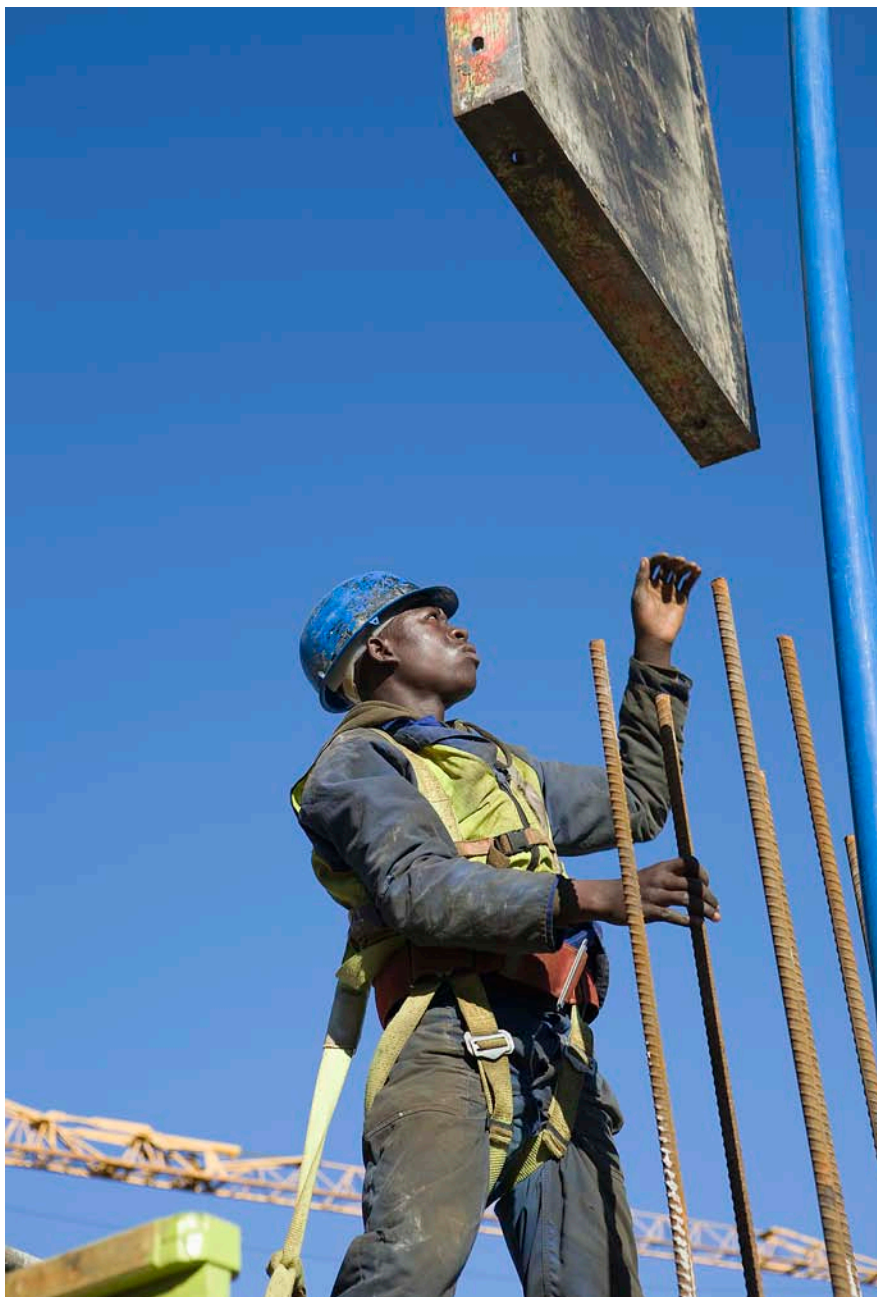
A la República del Congo, on el petroli representa el 80 per cent de les exportacions, experimenten un ràpid creixement la construcció i el transport a la capital incentivats pels Jocs Panafricans.

construcció. El 2013, la pesca es va expandir en un 10%, i l'agricultura en un 9%. Actualment, si fa no fa un terç dels ingressos del Govern prové de fonts no petrolieres, en comparació d'un percentatge gairebé inexistent fa una dècada, segons els economistes de Standard Bank.