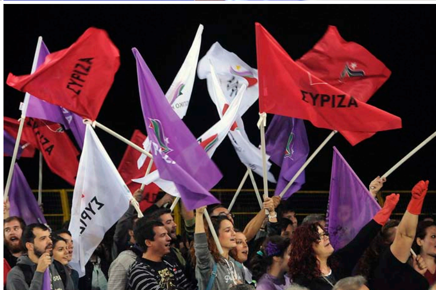
Alemanya ha estat bel·ligerant amb Grècia des del primer rescat, i ha estat el país que ha posat en qüestió la permanència del país hel·lè a l'eurozona si Syriza guanya les eleccions el 25 de gener.

bé està ara més preparada que el 2010 i el 2011 per suportar la sortida de l'economia grega de l'euro, a hores d'ara hi té massa diners invertits, que quedarien en risc si Grècia sortís de l'euro i afrontés sola el pagament del deute. La banca alemanya concentra la major exposició al deute grec del món, i seria, per tant, la més exposada a un accident financer a Grècia. Segons dades del Banc Internacional de Pagaments corresponents al juny de 2014, l'exposició de la banca de tots els països al deute grec, tant directa, mitjançant la tinença de deute plúblic, financer i corporatiu, com indirecta, a través de derivats i altres garanties,