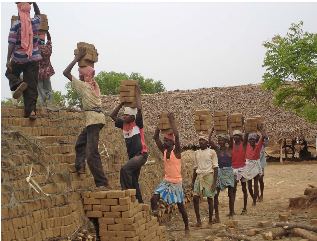
Els treballadors de la fàbrica de maons, nens de tres anys a qui s'assignen tasques inclosos, només abandonen el recinte amb el permís de l'amo.

durà mitja hora. En aquesta conversació i també en les pròximes durant un any, explicarà la història de la seva vida. La casa dels seus pares és la raó per què es convertí en esclau. Fa setze anys, quan en tenia 12, els seus pares agafaren un crèdit de 35.000 rupies, avui dia uns 275€, prestat de Khan, el propietari de la rajoleria. Volien comprar un terreny i construir-hi una casa de dues habitacions amb els pocs estalvis que tenien.