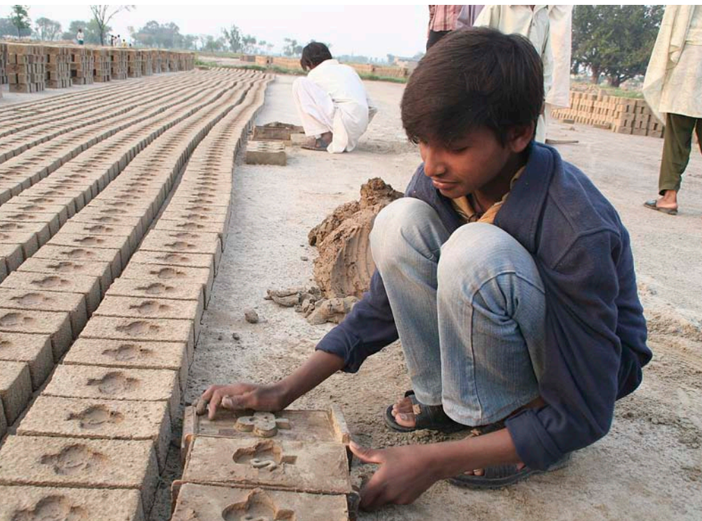
Un nen treballa en l'elaboració de maons a Kasur, controlat per clans que subornen la policia. Els amos defensen que no tenen esclaus, sinó persones que salden els seus deutes treballant.

Però si aquest crèdit és impagable, quina manera hi ha de sortir-se'n?