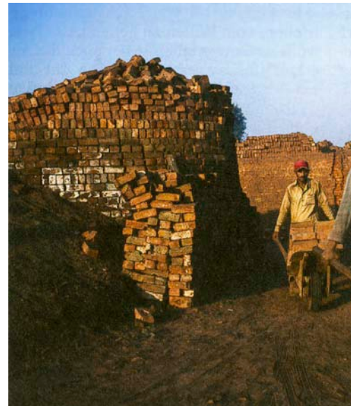
Treballadors de la destil·leria de maó a la po-

A més a més, l'esclavitud és prohibida al Pakistan. La Constitució prohibeix l'esclavitud i els treballs forçats. La servitud per deutes, és a dir, lliurar