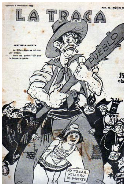
D'esquerra a dreta: acudit de Junceda que va disparar l'atac dels oficials de la caserna del Bruc a Barcelona, efectes de l'explosió a la redacció d'El Papus i portada de La Traca.

Hara-Kiri , com Charlie Hebdo , inquietava i disgustava l'autoritat democràtica francesa. Quan Charlie va reproduir l'any 2006 les caricatures de Mahoma que havia publicat el diari danès Jyllands-Posten i que havien aixecat en ira i armes els sectors més retrògrads de l'islamisme, el president Jacques Chirac va titllar l'ocurrència de "provocació". Dimecres, François Hollande apel·lava als valors suprems de la república. Un valor suprem hauria de ser no confondre provocadors amb provocats. El darrer episodi de Charlie Hebdo ha estat el fermall sagnant d'una cadena d'incomprensions que no es poden atribuir al fonamentalisme islàmic.