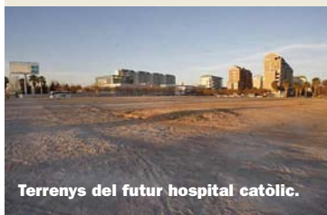
Terrenys del futur hospital catòlic.

que comptarà amb 200 llits i més de 500 treballadors. Una mica més lluny hi ha l'hospital públic de Manises, gestionat per Sanitas des de novembre del 2012, que compta 350 llits. El departament de salut de què és "hospital de referència" va absorbir llavors la població de Ribarroja, prèviament adscrita a l'Arnau de Vilanova, 100% públic.