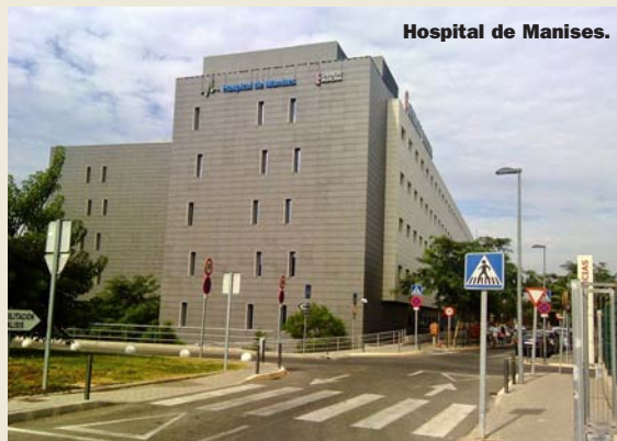
Hospital de Manises.

Davant la degradació progressiva de la sanitat pública valenciana, hi ha l'altra cara del sistema, aquells que se'n beneficien, és a dir, la iniciativa privada. Segons els grups de l'oposició, aquesta i no una altra és la veritable intenció, la gran finalitat dels responsables de la Generalitat Valenciana. Els hospitals privats i de gestió privada han trobat recer en les polítiques impulsades pel PP. D'una banda, hi ha el futur hospital de la Universitat Catòlica Sant Vicent Màrtir –precisament, al barri de Campanar–, que tindrà 180 llits en un solar de 13.000 metres quadrats on els estudiants realitzaran les seues pràctiques. A més, hi haurà el nou hospital privat del grup IMED a Burjassot –un municipi de l'àrea metropolitana que també queda ben a prop de Campanar–,