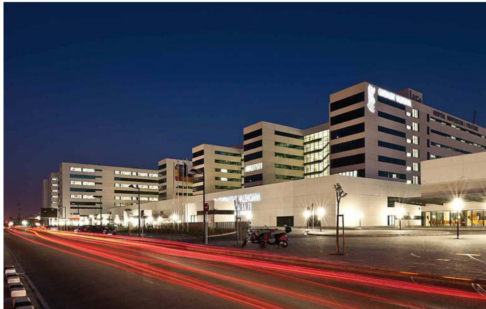
El trasllat de l'hospital La Fe al barri de Malilla, ara fa tres anys, va deixar els veïns del districte de Campanar sense el seu hospital de referència.

tituirà l'Arnau de Vilanova". L'anunci, que va sorprendre tothom, ha confirmat les sospites d'alguns: el Govern valencià pretén tirar a terra les antigues instal·lacions i construir-ne de noves als terrenys alliberats. No sols als de la Fe, sinó també als de l'Arnau, ubicats a poc més d'un quilòmetre de distància. L'enderroc es produirà a partir de les acaballes del 2015, les obres s'iniciaran el 2016 i seran inaugurades el 2018. Tot plegat enmig d'una conjuntura econòmica molt adversa, amb una Generalitat que arrossega més de 36.000 milions d'euros de deute i comunicat a cinc mesos d'unes eleccions que, segons totes les enquestes, posaran punt i final a 20 anys de governs del PPCV.